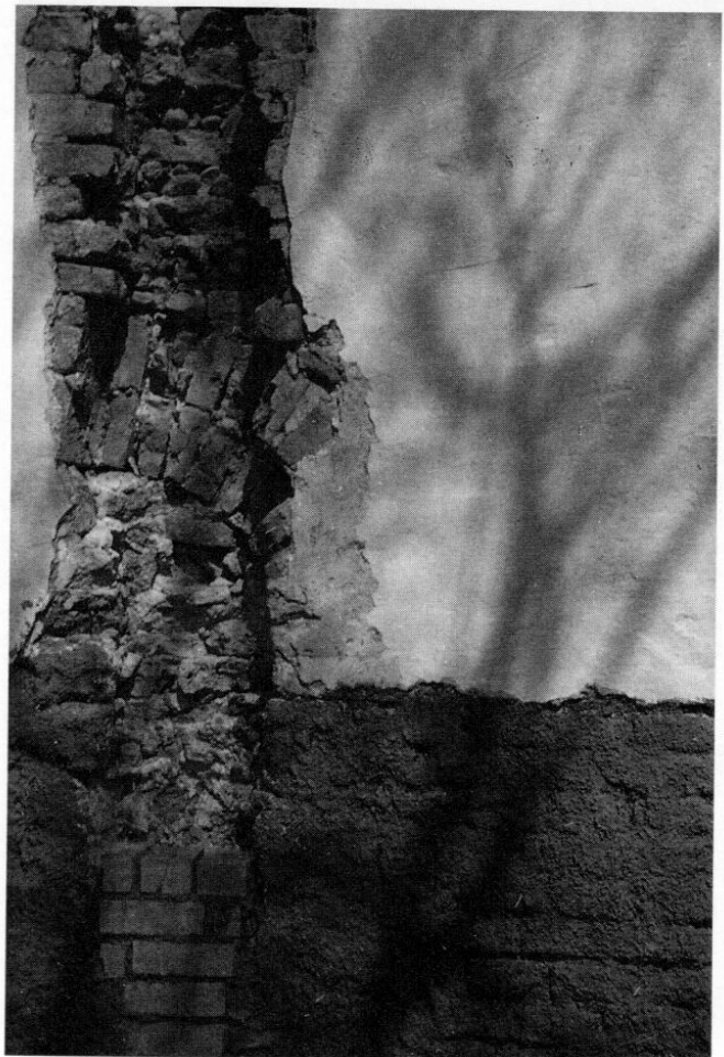
Korbboegen an der Südseite der Georgskapelle in Roggenstein.