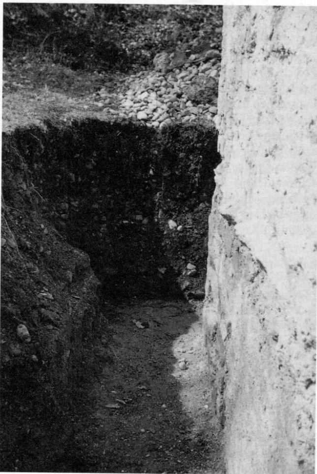
Fundamentrest an der Roggensteiner Georgskapelle; Turm, an der Südwestecke.

Die Freilegung des Kapellenfundamentes brachte eine