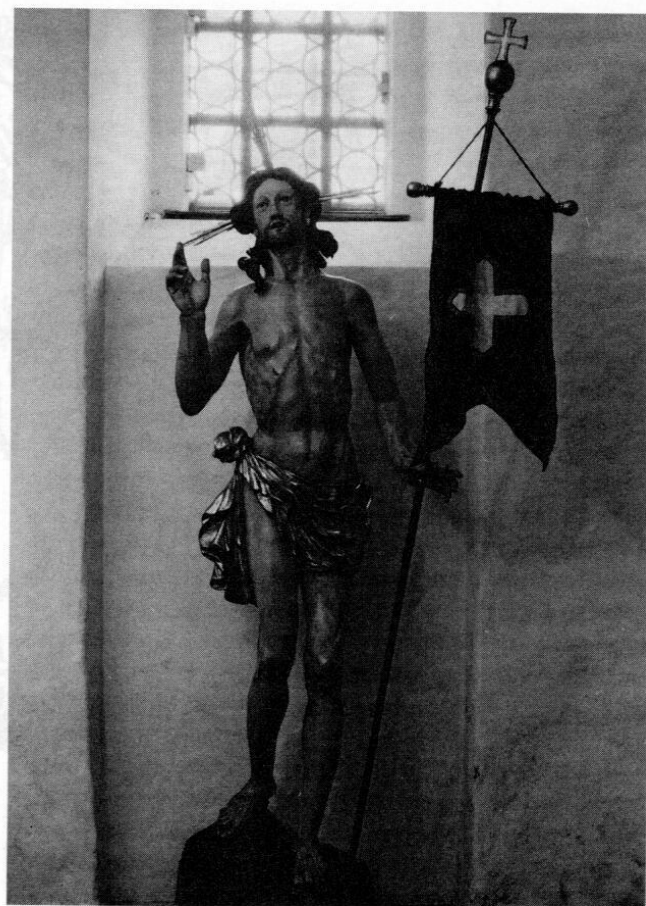
Eine der Neuentdeckungen aufgrund der Kirchenrechnungseinträge ist die Erkenntnis, daß der Auferstehungschristus der Pfarrkirche in Hohenkammer ein Werk des Münchner Bildhauers Anton Zächenberger aus dem Jahre 1777 ist.