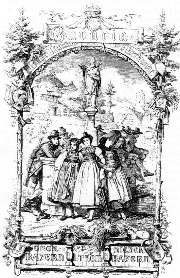
Frontispiz des ersten Bandes der von Wilhelm Heinrich Riehl herausgegebenen »Bavaria. Landes- und Volkskunde des Königreiches Bayern« (1860).