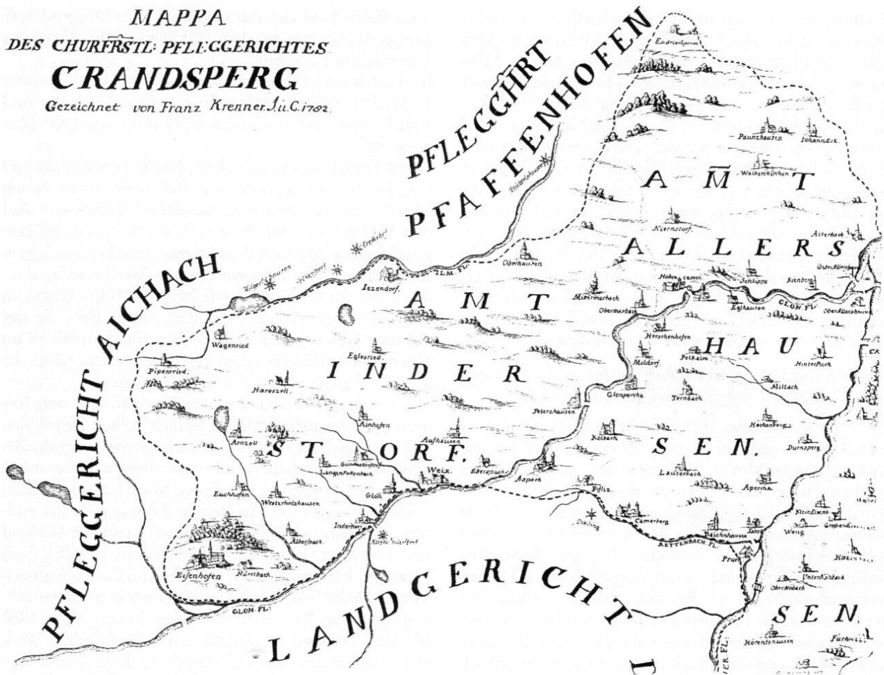
Ausschnitt aus der Karte des Pfleggerichts Kranzberg von Franz Krenner (1702). Der Teil, der bei der Gebietsreform von 1803 dem Landgericht Dachau zugeschlagen wurde (v. a. Amt Indersdorf), wurde nachträglich rot markiert.

1806 Königreich) zum modernen Staat. Notwendig waren diese Reformen nicht zuletzt auch aufgrund des gewaltigen Gebietszuwachses v. a. in Franken und Schwaben infolge von Säkularisation, Mediatisierung und napoleonischen Kriegen geworden. Um sich zum einen einen Überblick über das gesamte aus zahlreichen und grundverschiedenen Territorien zusammengefügte Staatsgebiet zu verschaffen und um zum andern der Staatsverwaltung im Dienste eines aufgeklärten Absolutismus Hilfsmittel zur Steigerung ihrer Effizienz an die Hand zu geben, wurde mit der Entschließung vom 27. September 1809 das statistische Großunternehmen der sogenannten »Montgelas-Statistik« für das rechtsrheinische Bayern eingeleitet. 32