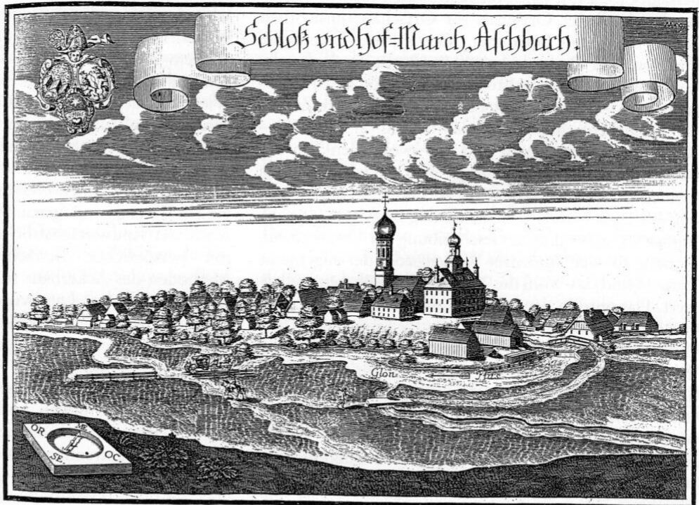
Das (geplante, aber nicht ausgeführte) Schloß in der zum Kloster Indersdorf gehörigen Hofmark Asbach (bei Petershausen). Kupferstich von Michael Wening aus dem ersten Band (Rentamt München) seiner Landesbeschreibung (1701).