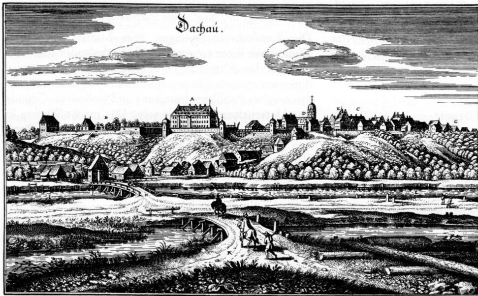
Der Markt Dachau von Südosten. Kupferstich von Matthäus Merian als Illustration seiner »Topographia Bavariae« (1644).

A Fürstlich Residenz Schloß. D. S. Jacobs Pfarrkirch. G. Der alte Markt. K. Straß nach München B. Fußli. wolliche Garten. E. Rathhaus. H. Amper bruck. L. Der Kühe weg. C. Der neue Markt. F. Hoffweg. I. Amper fuß.