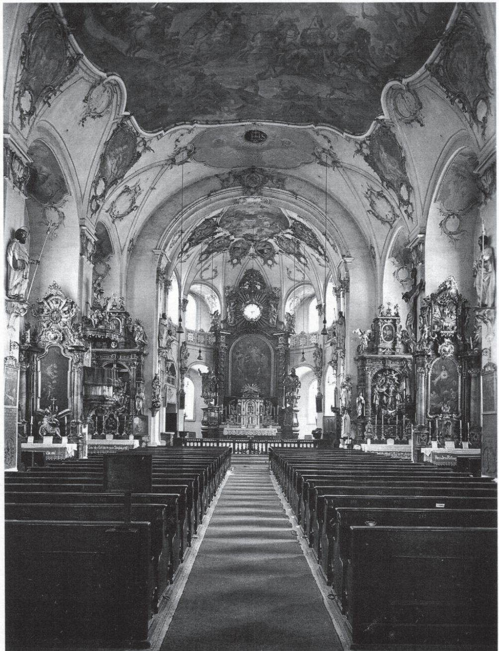
Zustand des Kirchenraumes von St. Magdalena, Fürstenfeldbruck vor 1972.

Bei einigen der genannten Objekte bereitete dies keine Probleme (Oratoriengitter, Apostelleuchter, Kreuzweg mit neuer Hängung und alten Aufsätzen, Holzluster im Altarraum), schwieriger verhielt es sich mit der Problematik des Hochaltars. Hier besteht seit der Entfernung des mächtigen Tabernakels im Jahre 1972 eine empfindliche Leerstelle im Altaraufbau, die bis heute nicht geschlossen ist. Verstärkt wird der aus historischer Sicht