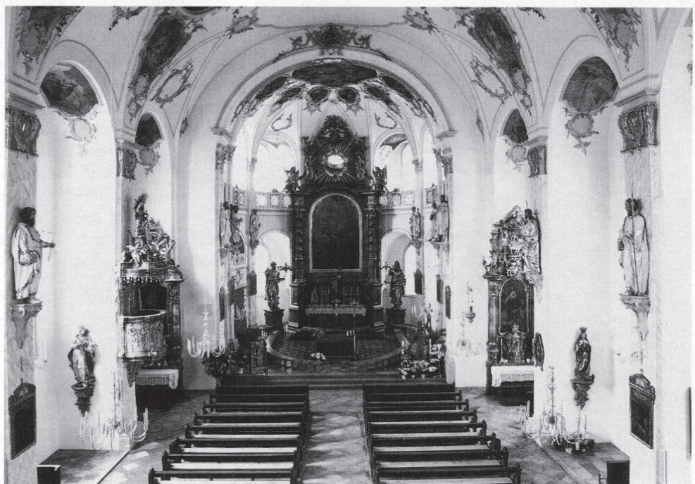
Innenraum von St. Magdalena, Fürstenfeldbruck, 1993 nach der Renovierung.