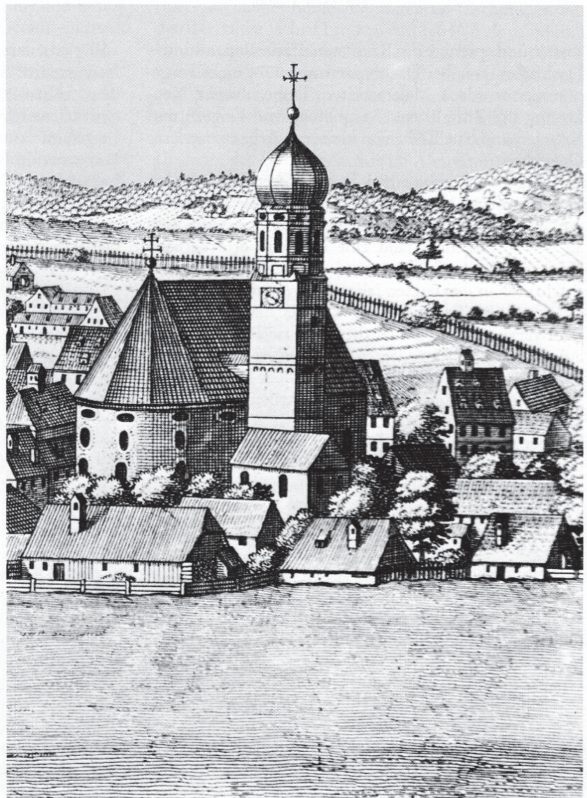
Ausschnitt aus Michael Wenings Ansicht von Fürstenfeldbruck aus seiner Historico-Topographia Descripto, 1. Teil, Rentamt München 1701, Tafel 71. Die Chorfenster der Pfarrkirche sind insgesamt in der heute nur noch in der Südachse vorhandenen Form dargestellt. 1964 wurde der Kirchturm nach diesem Kupferstich rekonstruiert.

Als erster Bauabschnitt der Gesamtmaßnahme wurde 1986/87 die Außeninstandsetzung durchgeführt. Zur Ausführung kam eine vollständige Putzerneuerung, hatte doch der Dispersionsanstrich der letzten Sanierung (1965) den alten Putz von 1912/13 weitgehend zerstört. Damit verbunden war eine Erneuerung der Spenglerarbeiten (ausgenommen die Turmzwiebel), eine Betonsanierung am modernen Kirchturm (seine Bewehrung