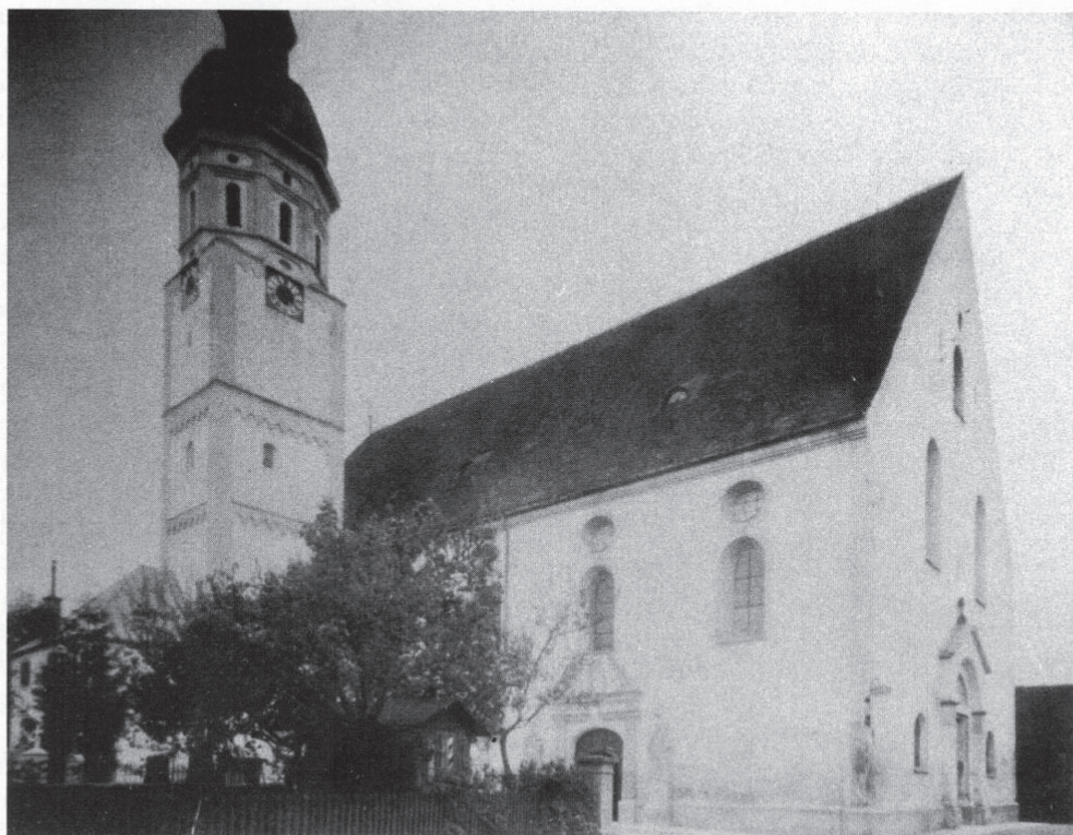
Nordwestansicht der Pfarrkirche St. Magdalena, Fürstenfeldbruck, aus der Zeit vor der Neugestaltung 1912/13.