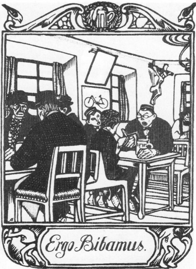
Abb. 4: Ignatius Taschner: Ergo Bibamus. Illustration zu Thomas »Der heilige Hies«.

Ist wütend auf d. Hausfreund. Traut sich nichts zu sagen, fängt an + läßt sich imponieren . . . Schulden . . . machen. Sein Besuch beim alten Förster. (Seite 4) Rutscht. Wird Weinreisender. Spielt Klavier, was er gut kann. Ein Lied vergangener Herrlichkeit. Sieht die ehem(alige) Gattin, auch heruntergek(ommen). Das ist die Geschichte vom Kapplerbräu.«