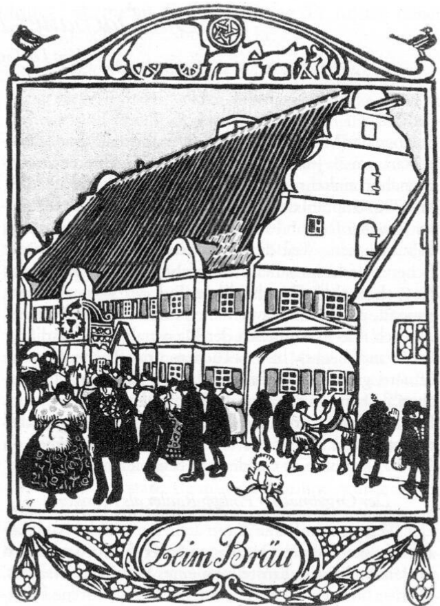
Abb. 7: Ignatius Taschner: Beim Bräu . Illustration zu Thomas »Der heilige Hies« .

mächtnis veröffentlicht durch Ludwig Schmid . Saal/Donau 1977; Lemp: Thoma u. Dachau 50–58.