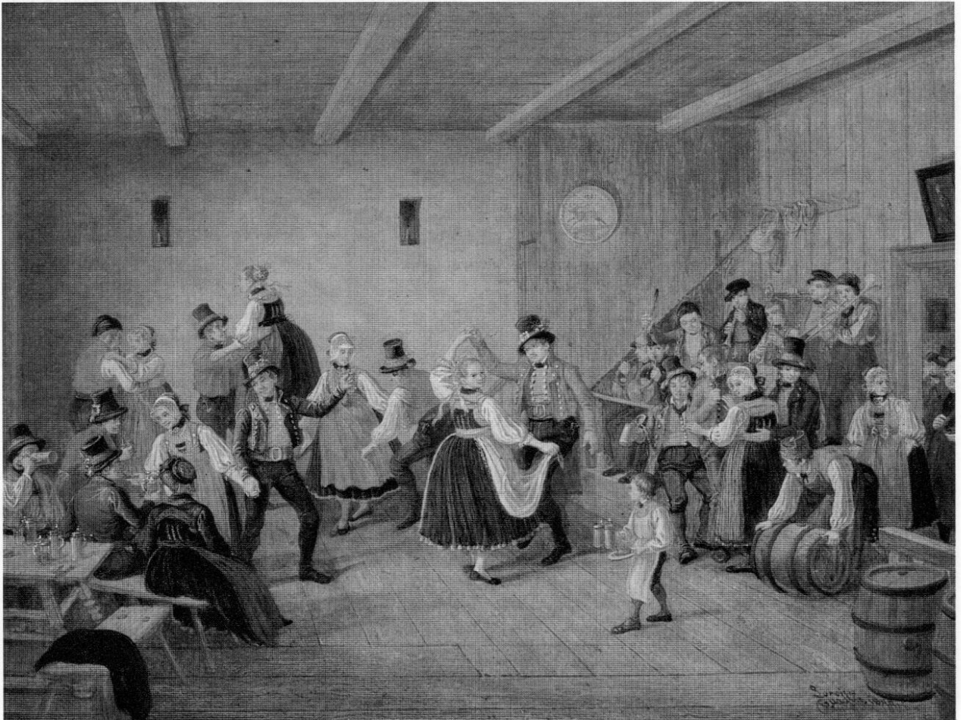
Lorenzo Quaglio: Die Tanzmusik spielt auf , 1846, Ö/P, 18 × 25 cm.