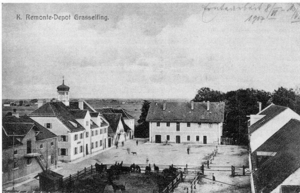
Abb. 3: Remonte-Depot Grasselfing, Lichtdruck-Ansichtskarte (um 1910).

Die wechselvolle Geschichte der ehemals kurfürstlichen Schwaige Graßlfing ist in der Chronik von Geiselbullach