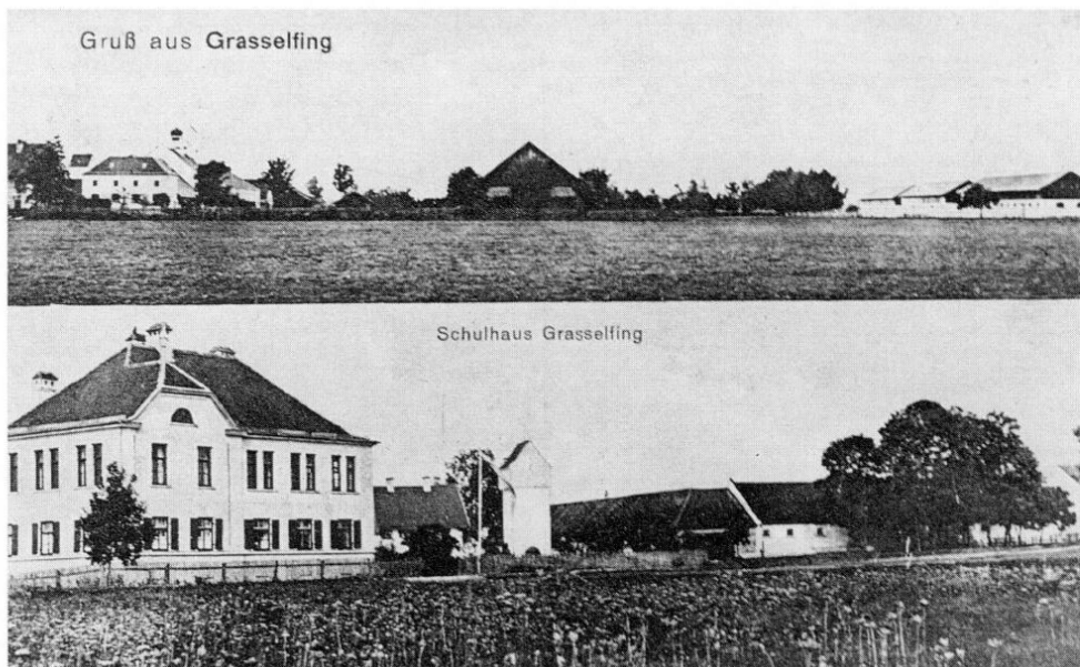
Abb. 4: Lichtdruck-Ansichtskarte von Grasselfing (um 1910): Schulhaus und Remonte-Depot.