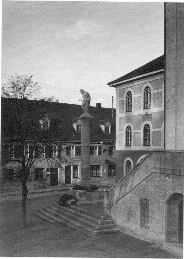
Das von dem Münchner Bildhauer Karl Kroher geschaffene Kriegerdenkmal in Dachau, Schrammenplatz, nach der Einweihung im November 1929.