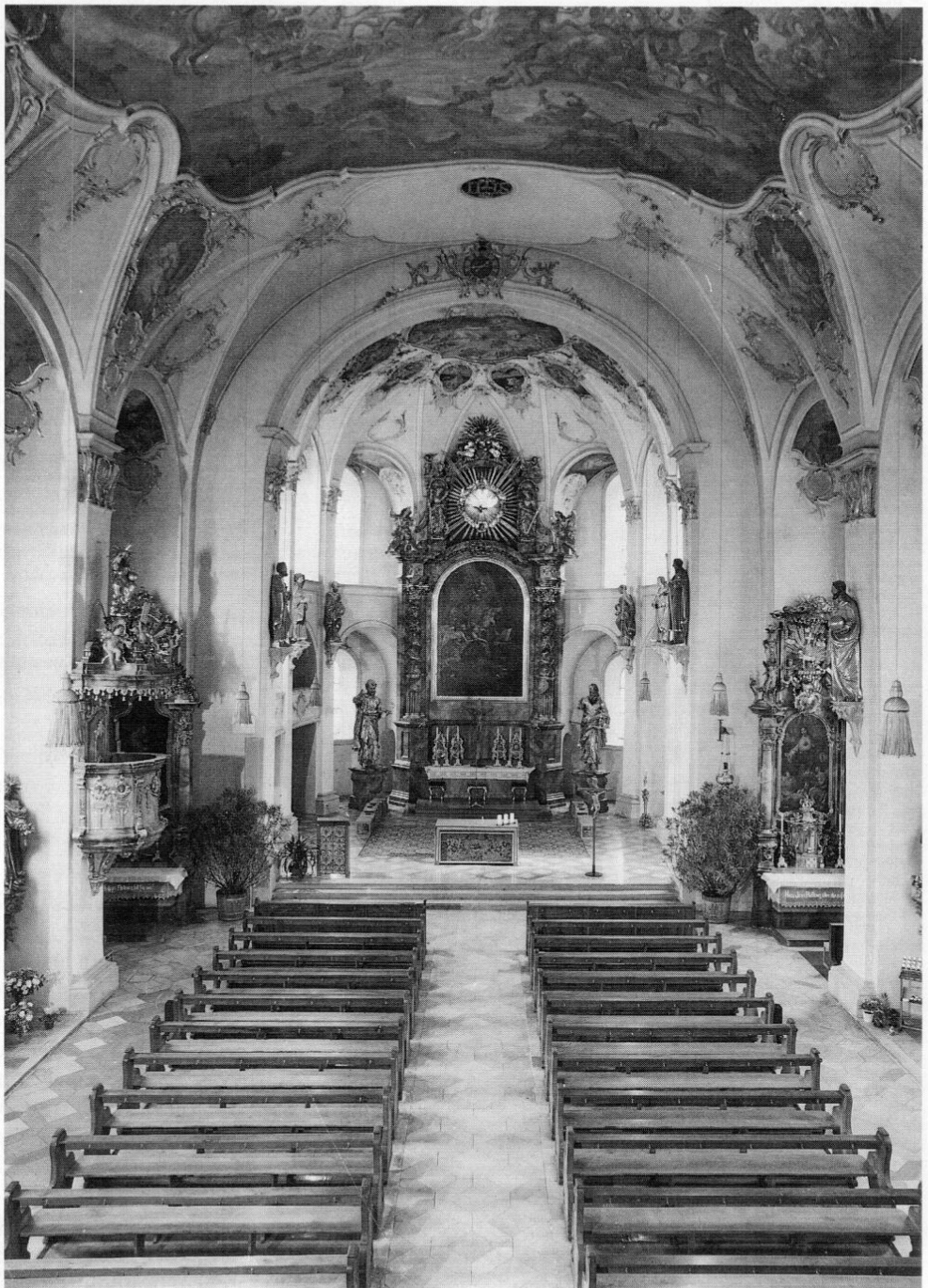
Fürstfeldbruck, Pfarrkirche St. Magdalena nach der Renovierung von 1970/72.

Neben der Reinigung des Kirchenraumes und seiner Fresken durch die Firma Mayerhofer und den Kunstmalers Müller-Werther aus Ebersberg war dabei eine »Entlastung des Baus von überreichlichen Ausstattungsgegenständen des 19. und 20. Jahrhunderts« 52 vorrangig. So verschwanden die beiden übermächtigen vorderen Seitenaltäre, an ihre Stelle rückten der Antonius- und der Herz-Jesu-Altar mit dem Tabernakel. Der Tabernakel des Hochaltars wurde entfernt, das alte, unansehnliche Altarbild durch eine Leihgabe der Staatlichen Gemäldesammlung München aus der Zeit um 1700 (»Tod der hl. Maria Magdalena«) ersetzt. Die Neugestaltung des Altarraumes mit Ambo und Zelebrationsaltar entsprach