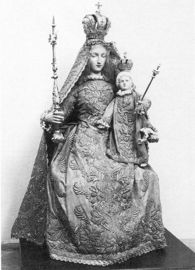
Fürstenfeldbruck, Pfarrkirche St. Magdalena, Rosenkranzmadonna, die bis 1871 auf dem Marienaltar stand.