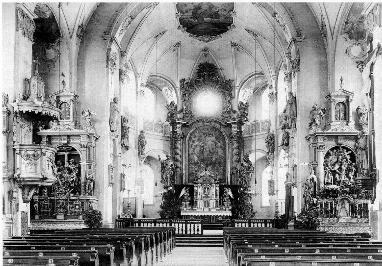
Fürstenfeldbruck, Pfarrkirche St. Magdalena vor der Innenrenovierung von 1912/13.