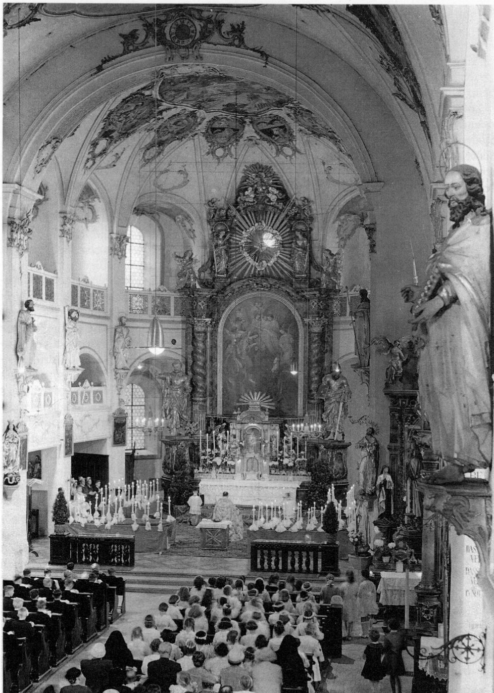
Fürstenfeldbruck, Pfarrkirche St. Magdalena nach der Innenrenovierung von 1912/13: Mit Stuck und Fresko im Chorraum von Ranzinger sowie zwei zusätzlichen Emporen (links unten).

Der erste festliche Gottesdienst in der neurenovierten Kirche konnte am Allerheiligentag 1913 gefeiert werden, am 16. April 1914 wurde anlässlich der Firmung durch Weihbischof Johann Baptist von Neudecker (1911–1926)