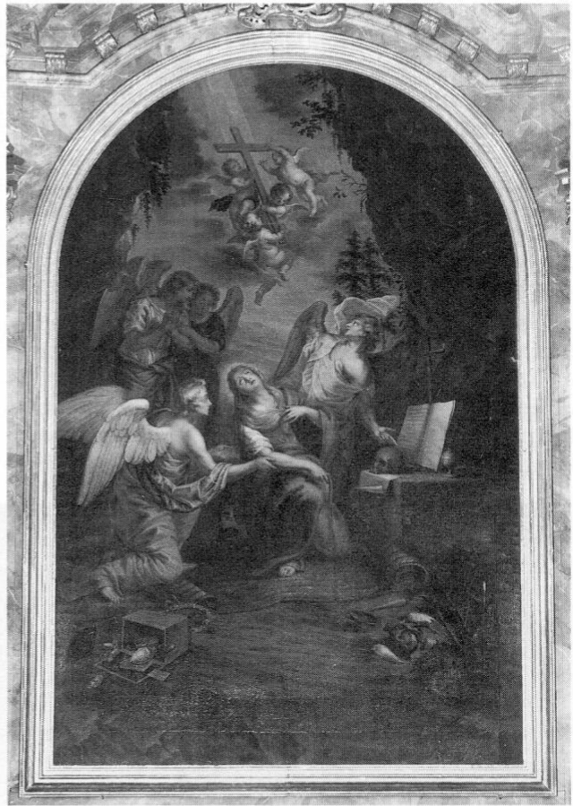
Fürstenfeldbruck, Pfarrkirche St. Magdalena, Hochaltarbild: Tod der hl. Maria Magdalena, um 1700. Leihgabe der Staatlichen Gemäldesammlung München.

Pfarrer Graßl faßte von Anfang an neben einer gründlichen Restaurierung im Einvernehmen mit dem damaligen Erzbischof Kardinal Bettinger (1909–1917) auch eine Vergrößerung der Pfarrkirche ins Auge, die jedoch schließlich trotz manchem Hin und Her und verschiedener Pläne nicht zur Ausführung kommen sollte. Dem Beginn der Arbeiten im Jahre 1912 gingen zahlreiche Schritte voraus. So zog man Erkundigungen beim königlichen Generalkonservatorium der Kunstdenkmale und Altertümer in Bayern und beim Deutschen Verein für christliche Kunst ein, ließ einen Kostenvoranschlag durch das Brucker Atelier Steiner und Pläne für die Erweiterung der Kirche durch den Münchner Architekten Schott erstellen und gründete, zur Finanzierung des ganzen Unternehmens, einen Kirchenbauverein, der dann auch in Form von Beiträgen und Spenden im