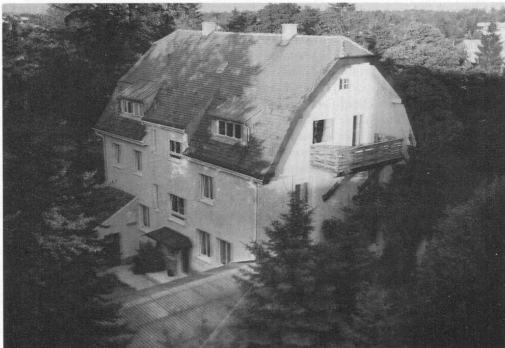
Abb. 1: Das 1911 erbaute Kinderheim in Neu-Esting, wie es ein Jahr vor seinem Abriß aussah.