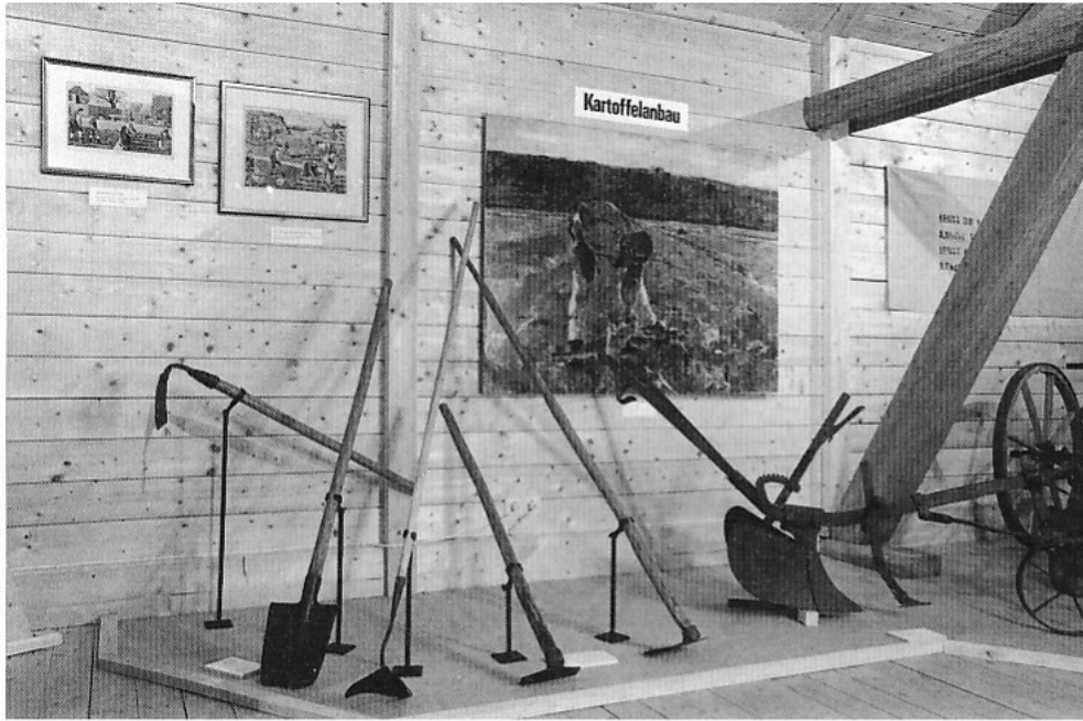
Handgeräte zum Kartoffelanbau.

Jexhof stellt in einer kleinen Inszenierung das berühmte Bild von Warthmüller nach, das den »Alten Fritz« bei der Inspizierung der Kartoffelernte zeigt.