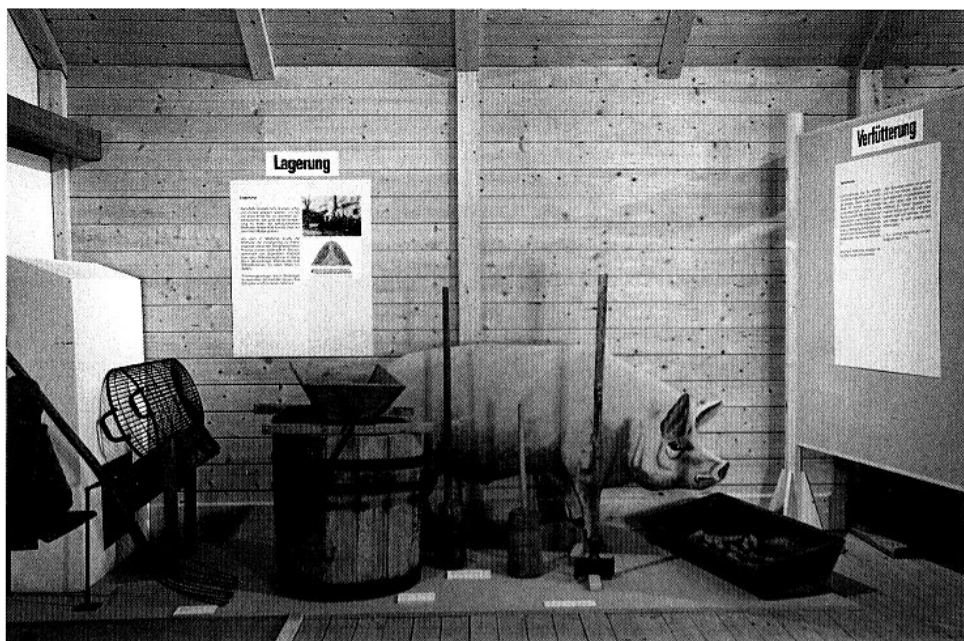
Anfangs diente die Kartoffel lediglich als Schweinefutter.

wendungsmöglichkeiten vorstellt, die früher durchaus einige Bedeutung hatten. So ist beispielsweise der Saft der rohen Kartoffel ein gutes Reinigungsmittel für Seidentücher und Silbergeschirr, und getrocknete Kartoffelschalen eignen sich vorzüglich zum Anschüren eines Kohlenherds. Nicht übersehen darf man den Kartoffelschnaps, der in manchen Privathaushalten zum Eigenbedarf gebrannt wurde. Als Wodka erfreut er sich auch heute einer großen Beliebtheit.