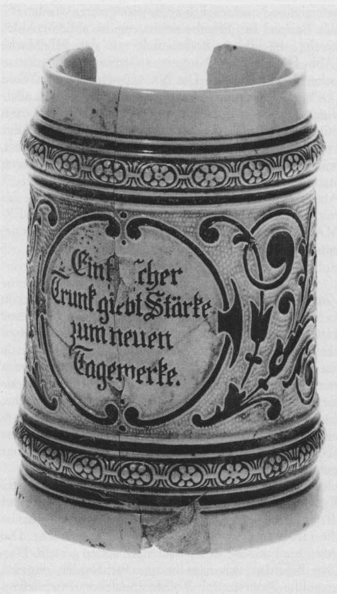
Abb. 8: Zylindrischer Krug aus Elfenbeinsteinzeug. H 13,6 cm.

Kommen wir nun zu einigen Beispielen. Abb. 8 zeigt einen zylindrischen Halbliterkrug aus Elfenbeinsteinzeug. Auf der Bodenunterseite sind die HR-Marke sowie die Nr. 236 (nicht bei Wald 1979) sichtbar. Auf der henkelabgewandten Seite beobachtet man eine aus zwei Halbbögen bestehende Kartusche, die den Spruch »Ein frischer Trunk giebt Stärke zum neuen Tagewerke« ein-