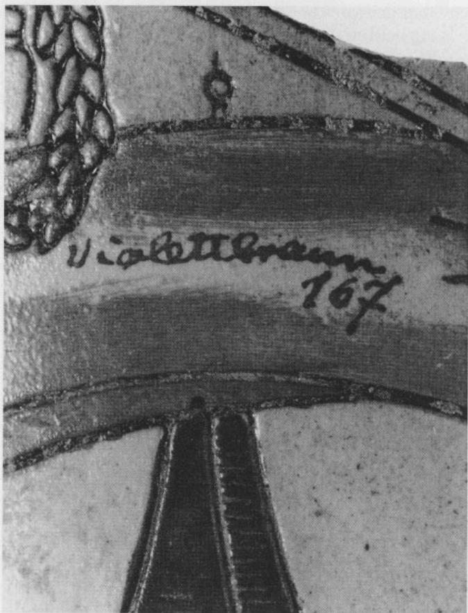
Abb. 7: Wandstück mit nachträglich aufgebracht Farbe und Farbbezeichnung. Größte Höhe 3,8 cm.

stücke bisher nicht rekonstruiert werden konnten. Auch sie sind überwiegend mit floralem Dekor (u. a. Weinlaub und Ranken) versehen. Daneben wurden Rollstempeldekore der verschiedensten Art beobachtet. Außer Stichdekoren (auch in Freising I) wurden ferner aufgelegte Rosetten (teilweise mehrfach gefüllt und mit Kreuz in der Mitte) sowie Löwenköpfchen festgestellt. Auch Friese mit Beschlagwerk und Masken fehlen nicht.