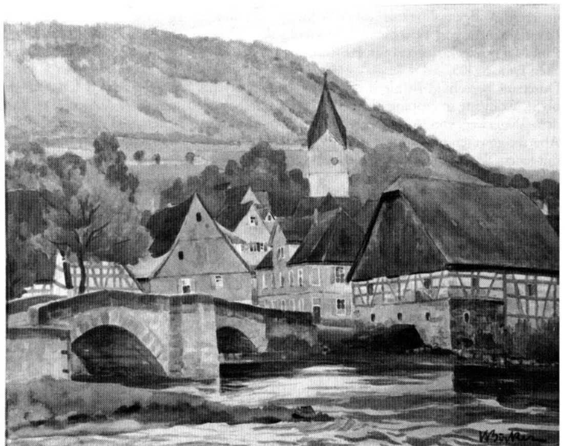
Hermann Böcker: Im Tal der Kocher. Aquarell.

Hermann Böcker übte seine Kunst stets – vor allem sich selbst gegenüber – kompromißlos aus. Er suchte den Kontakt zur Natur auch bei Unbilden der Witterung, um sie in all ihren Erscheinungsweisen zu erleben. Ein heftiger Sonnenbrand oder gar eine schwere Erfrierung