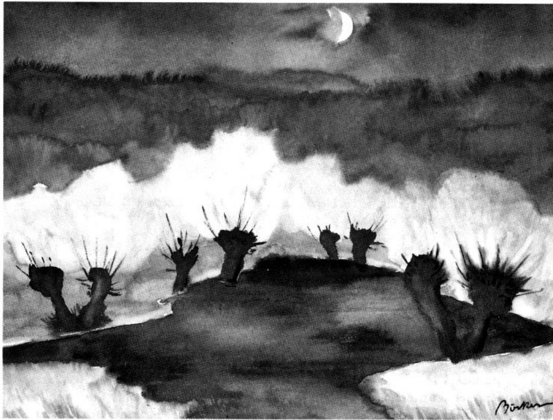
Hermann Böcker: Mondschein über dem Weidenteich. Aquarell.

in einer reichen Ausstellungstätigkeit; eindrucksvolle Presseberichte bezeugen die begeisterte Reaktion seitens der Öffentlichkeit. Den absoluten Höhepunkt dieses Wirkens stellt die eingangs erwähnte Stiftung von 1972 dar.