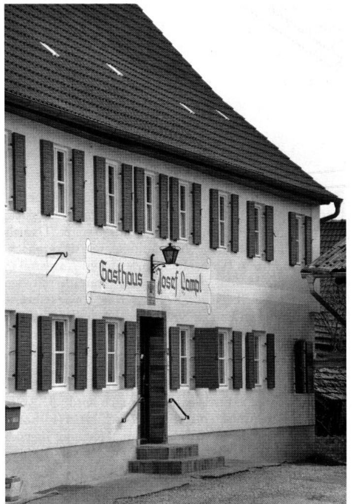
Der »Lampl-Wirt« in Pipinsried, traditionelle Einkehr der im Dorf und in den Nachbarorten ansässigen Bauern, Güter und Handwerker, war am 21. April 1890 Ausgangspunkt eines entsetzlichen Verbrechens.

Während einer der beiden Gendarmen noch andere Räume im Tanderner Schusterhäusl durchsuchte, blieb der andere zur Bewachung des gefesselten Delinquenten in der Wohnstube zurück. Regauer nestelte, scheinbar seinem Schicksal ergeben, an seinem Schuhwerk herum, sprang in einem günstigen Augenblick unvermittelt zur