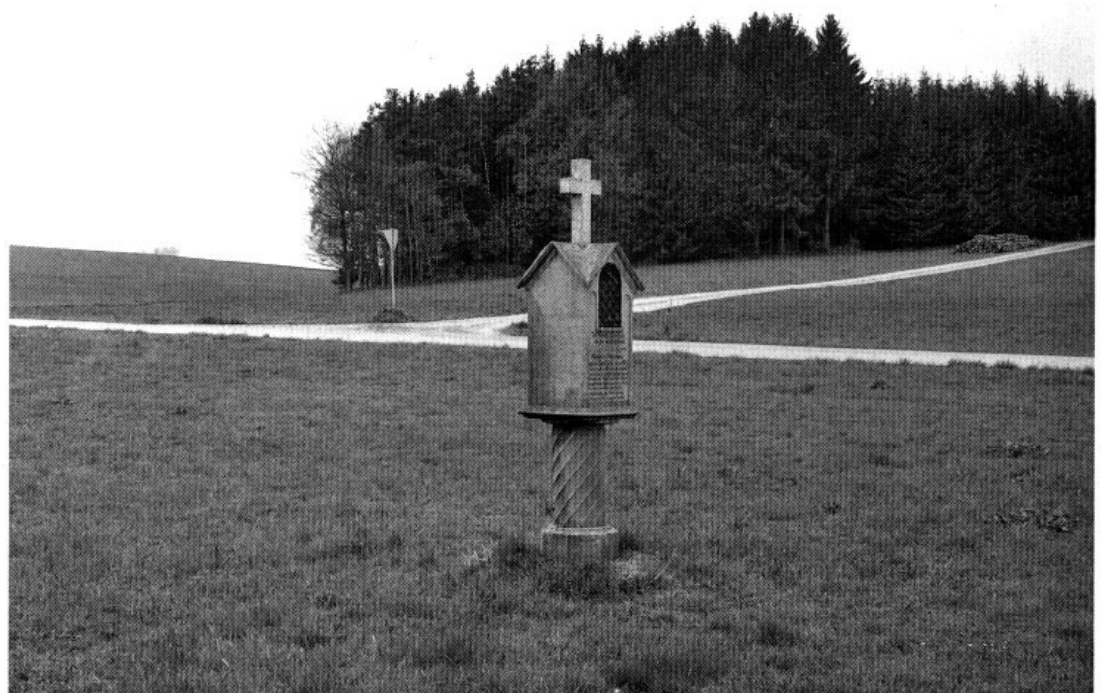
Der Tatort im sogenannten »Ilmgrund«, wo der Weg vom Weiler Obertsloh herab in das Sträßchen von Pipinsried nach Ottelsburg einmündet.