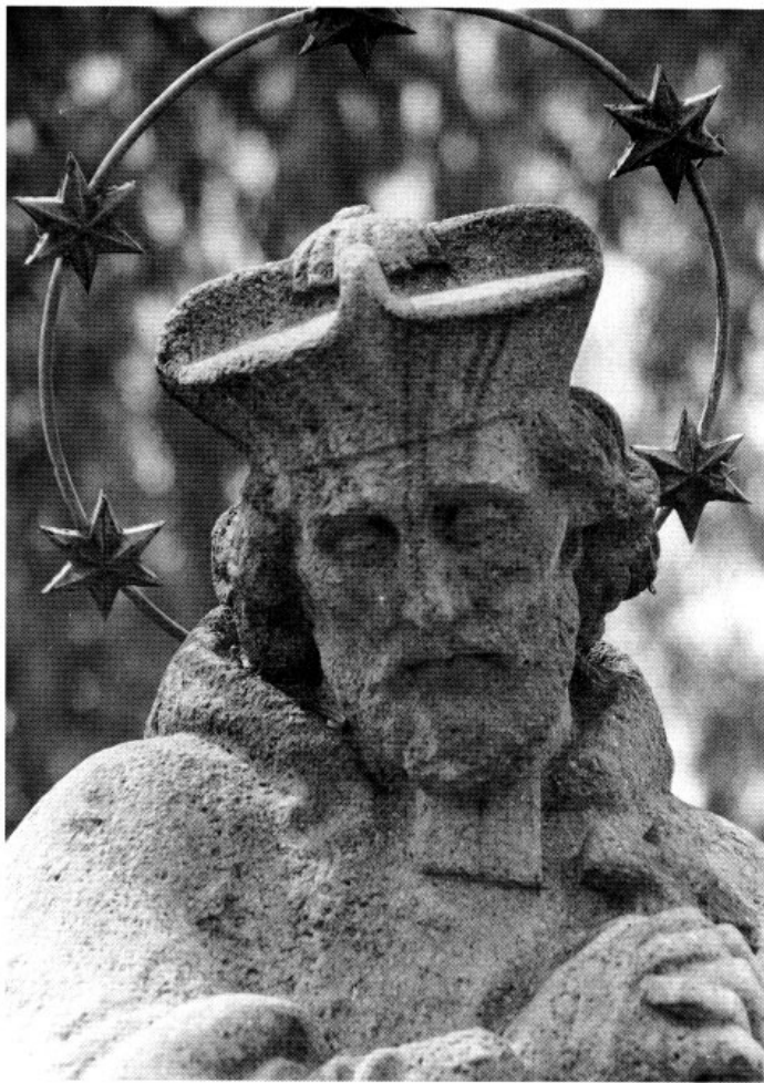
Kopf des hl. Johann Nepomuk von der Amperbrücke in Fürstenfeldbruck.

spondenz nur von »uralter Zeit« die Rede ist. Am 2. August 1875 schrieb das Bezirksamt Bruck an den Magistrat »betreffs öffentlicher Denkmäler«, daß an der hiesigen Amperbrücke die Statue des hl. Johannes Nepomuk »plötzlich entfernt und durch eine andere hölzerne von zweifelhaften Wert ersetzt worden ist. Ohne nun auf Form und Gestalt dieser Statue des Näheren einzugehen,