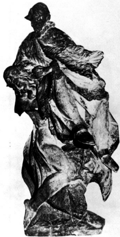
Die 96 cm hohe Darstellung mit dem Flußgott Moldau, der auf der Schulter den hl. Johann Nepomuk trägt, schnitzte Johann Baptist Straub für den Brunnen vor dem Jesuitenkolleg in München. Diözesanmuseum Freising, D 7361.