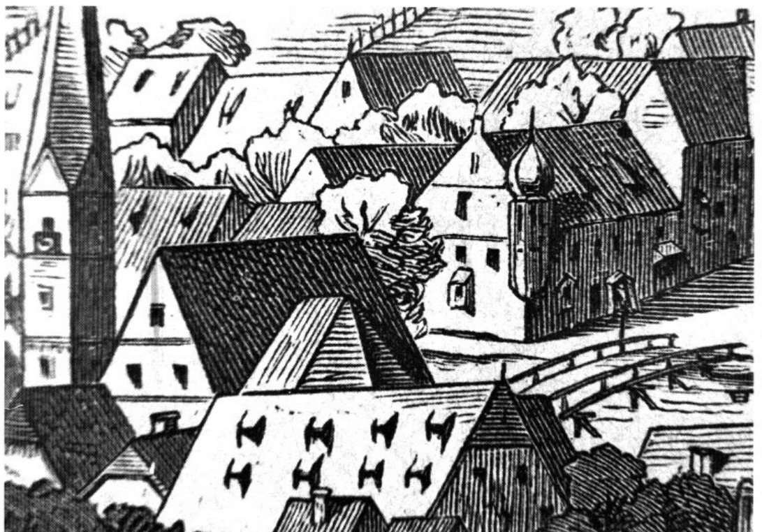
»Ober Bruckh nebst Fürstenfeldt gelegen«, so lautet die Überschrift zum Kupferstich von Michael Wenig von 1701. Hier ein Ausschnitt mit der Amperbrücke.

Am 23. August 1875 beschloß das Kollegium der Gemeindebevollmächtigten einstimmig, daß die alte Statue anstatt der hölzernen wieder an seinen Platz gestellt wird (13 Unterschriften). Der Magistrat meinte dagegen am 13. September, daß es besser wäre, »eine neue Figur aus Stein anzuschaffen«. Schließlich berichtete der Bürgermeister am 14. Oktober nochmals ausführlich an das Bezirksamt, die gegenwärtige Statue aus Holz werde nicht angekauft. Sie sei Eigentum des Münchner Kunst-