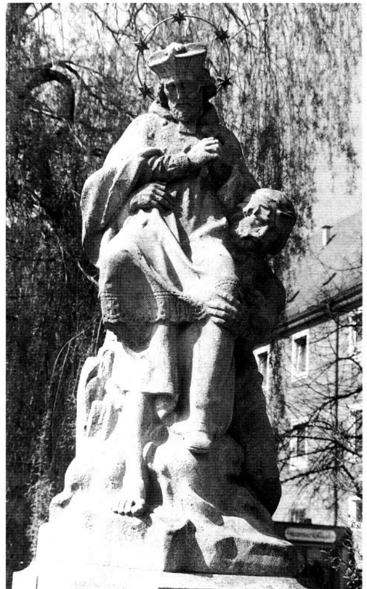
Franz Hoser schuf 1924 frei nach J. B. Straub die neubarocke Figurengruppe des Flußgottes Moldau und des hl. Johann Nepomuk für die Amperbrücke in Fürstenfeldbruck.