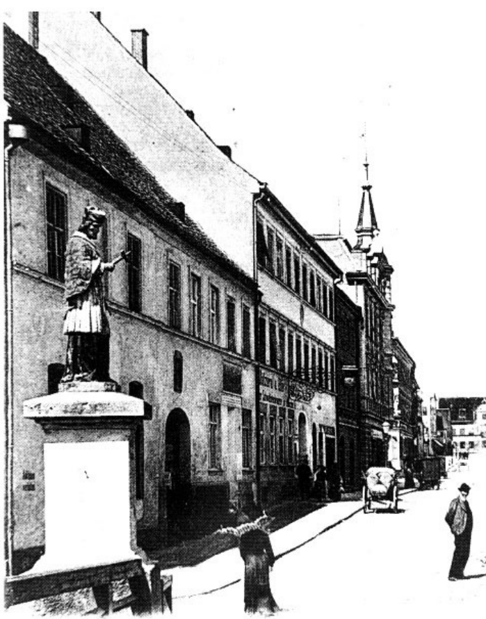
Aus Terrakotta war die Statue des hl. Johannes von Nepomuk, die von 1878 bis 1924 am Ende der hölzernen Amperbrücke stand. Ausschnitt einer Postkarte von 1904.