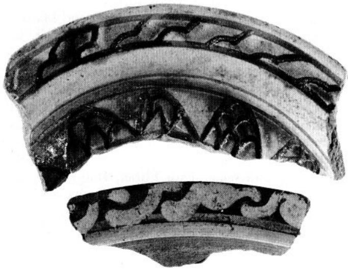
Abb. 10: Zwei Randstücke von malhornverzierten Schälchen bzw. Schüsseln. Durchmesser der Mündung 11 bzw. 19 cm.

Alfred Walcher v. Moltheim: Der Fertiger der sogenannten Hirschvogelkrüge. Kunst und Handwerk 7 (1904) 486–495, mehrere Abb. Alfred Walcher Ritter v. Moltheim: Bunte Hafnerkeramik der Renaissance in den österreichischen Ländern. Österreich ob der Enns und Salzburg. Wien 1906, 120 S., 140 Abb.