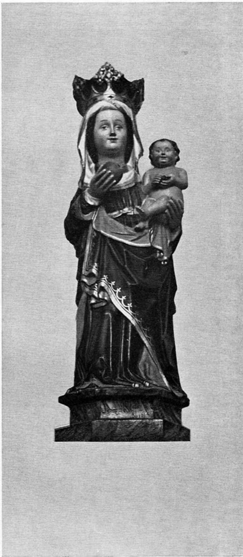
Wang, Madonna mit dem Kind, bemalte Tonfigur, 15. Jahrhundert.