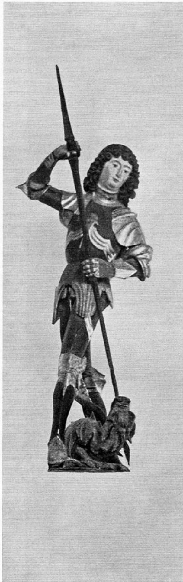
Gelbersdorf, St. Georg, bemalte Holzplastik von Helmschrot, 1482.