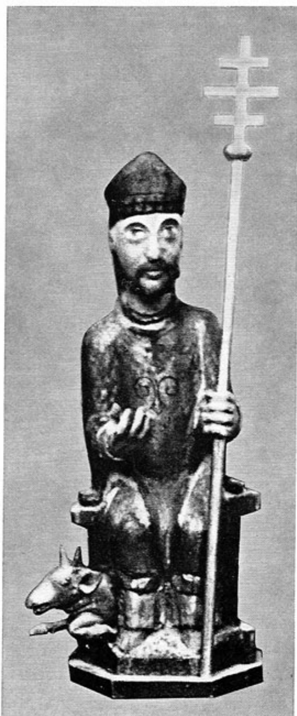
Airischwand, Sankt Sylvester, 13. Jahrhundert