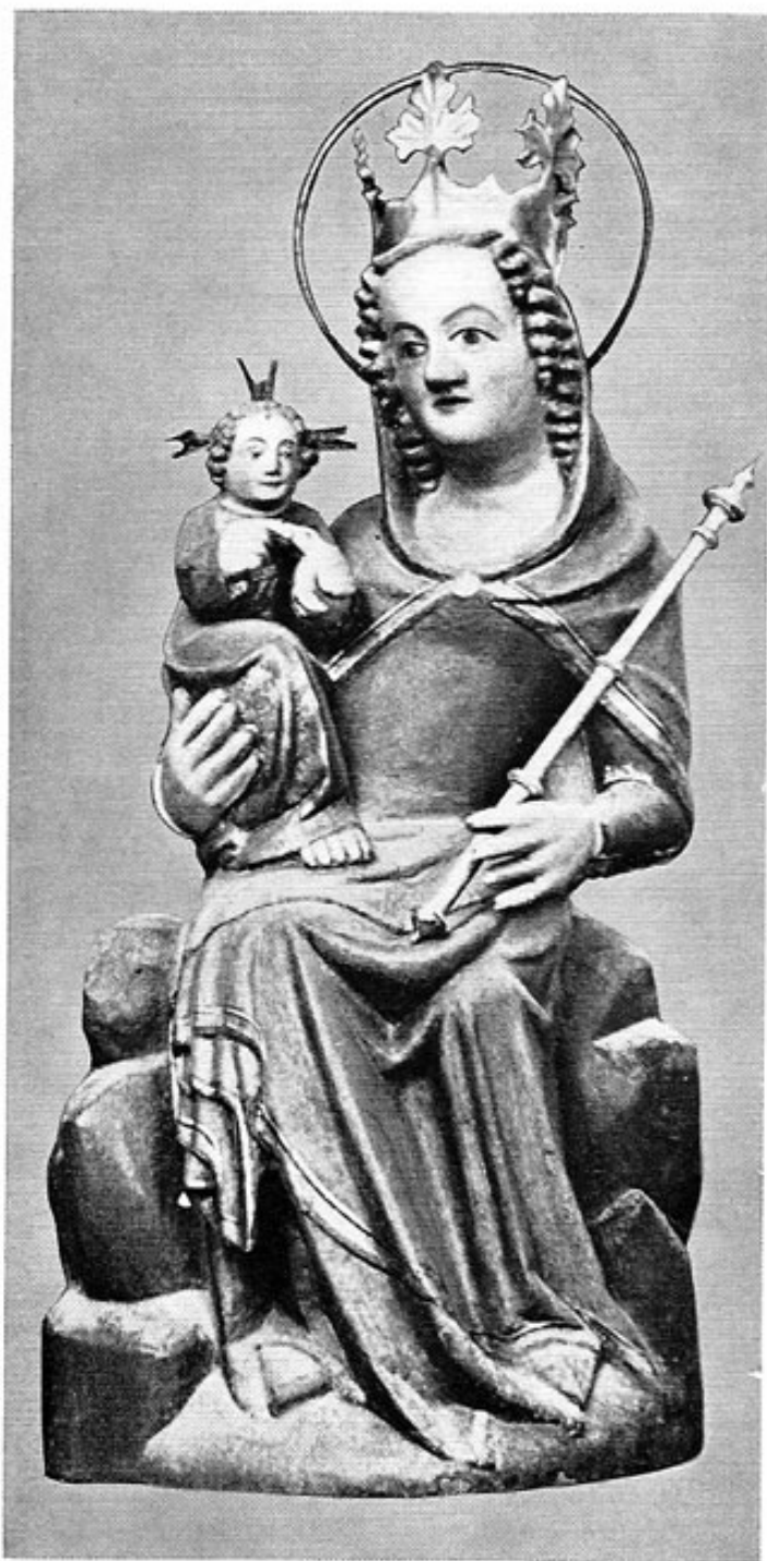
Airischwand, sitzende Gottesmutter, frühes 14. Jahrhundert

Umso erfreulicher erscheint es, daß die Romanik in Architektur, Plastik und Freskomalerei noch gut vertreten ist, mit Beispielen, die als charakteristisch bezeichnet werden können. Freising und Moosburg dien-