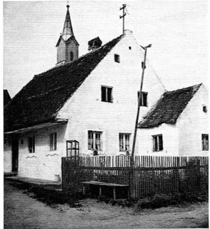
Austragshäusl in Albersbach