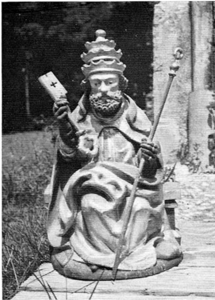
St. Peter von Edenholzhausen.

Edenholzhausen liegt in der Gemeinde Schwabhausen und gehört zur Pfarrei Arnbach. Es hat zwei Höfe, den Talbauern Glas und den Bergbauern Göttler. Früher gab es hier drei Höfe. Sie lagen abseits vom Verkehr in einer „Öde“ im Wald, im Holz; daher der Ortsname Edenholzhausen. Auch heute steht noch genug Wald dort. Den Hang hinauf zum Berghof gibt er mit mächtigen Eschen