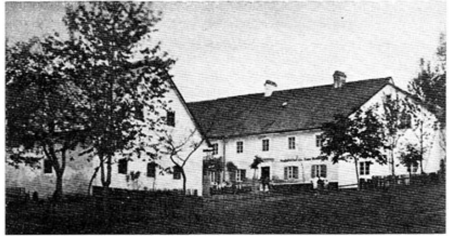
Gastwirtschaft Kettner in Pftetrach

Um welchen neuerlichen Fall es sich hier handelt, erfahren wir aus dem Antwortschreiben der Herrschaftsherrin