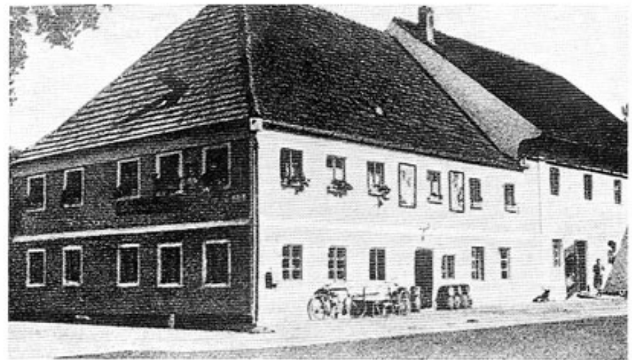
Gast- und Tafernwirtschaft Reichertshausen