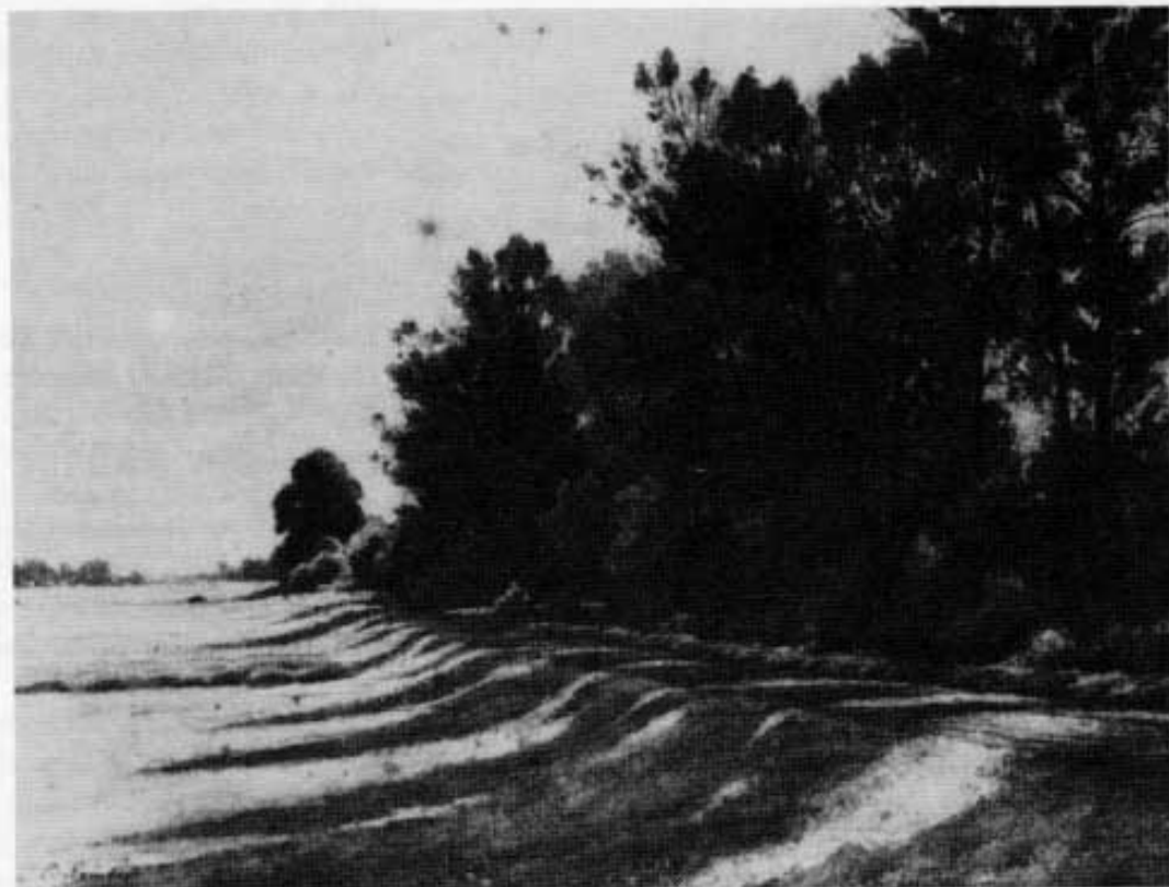
Die alte Pollnstraße um 1907. Zeichnung von Carl Reinhold.

Er stand auch droben am Dachauer Schloßberg: »Eine wunderschöne und unermessliche Ebene. Weite Flächen sind Moore« notierte er. Dann sucht sein Auge die Bäche und Flüsse: »Die wichtigsten sind folgende: die Amper ist am bedeutendsten, dann kommt gleich die Würm.« Auf der Wanderung durchs Land erfaßte er dann die Gewässer im einzelnen: »Bei Ober- und Untermenzing erstreckt sich auf der rechten Seite der Würm ein herrlicher und für Jagden sehr beliebter Forst nach Norden zu. Unterhalb von Allach, ungefähr zweitausend Schritte vor Dachau, teilt sich die Würm in zwei Arme, die sich wenig später wieder vereinigen und gleichsam eine Insel zwischen sich lassen. Der westliche Arm fließt an der Rothschwaige vorbei, der andere auch Reckenbach genannt, vereinigt sich — nachdem er noch den Schabenbach aufgenommen — wieder mit dem vorigen. So fließt die Würm durchs weite Land und treibt schließlich die Mühle an, die von ihr den Namen hat, die Würmmühle. Dann mündet