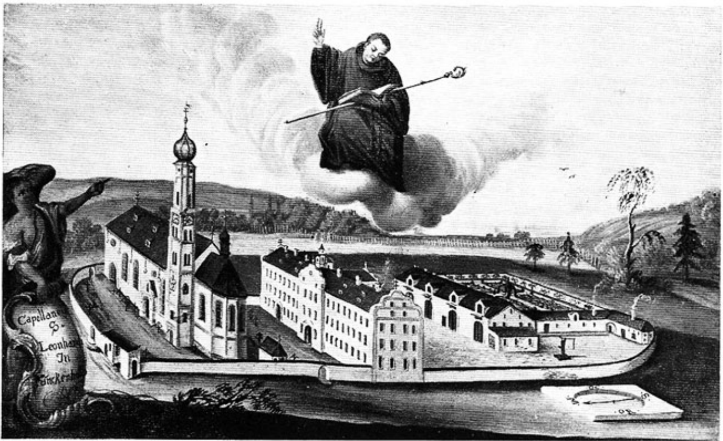
St. Leonhardskirche in Inchenhofen