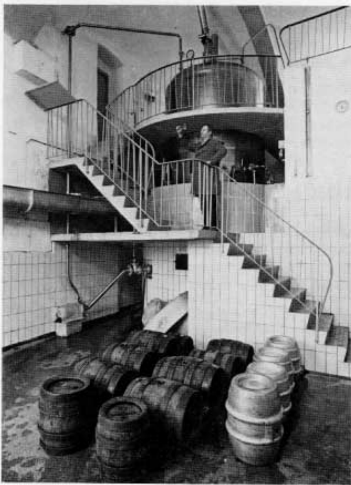
Sudhaus der Mayrischen Brauerei in Vierkirchen.