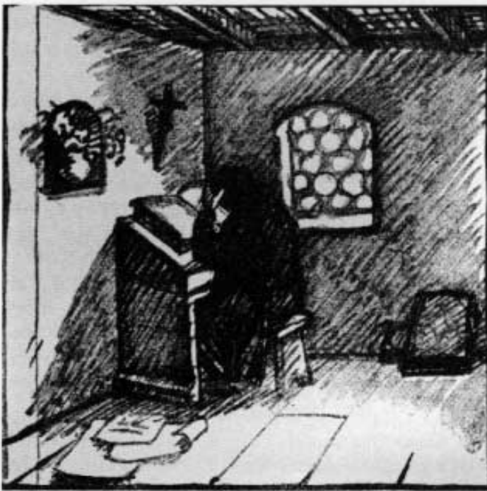
Abb. 2: Otto Wirsching: Illustration zu Scheffels »Ekkehard«.

Öl- und Aquarell-Technik, andererseits Grafiker, ein feiner Zeichner, ein großartiger Holzschneider. Wir werden zu sehen haben, wie sich auch geistig bei ihm diese beiden Gebiete ausprägten und zugleich trennten.