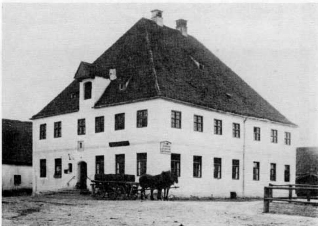
Gastwirtschaft »Zum Bräu« in Vierkirchen vor dem Ersten Weltkrieg.

In den vergangenen Jahrzehnten wuchsen dem Verein neue Aufgaben auf dem Gebiet des Blumenschmuckes, der