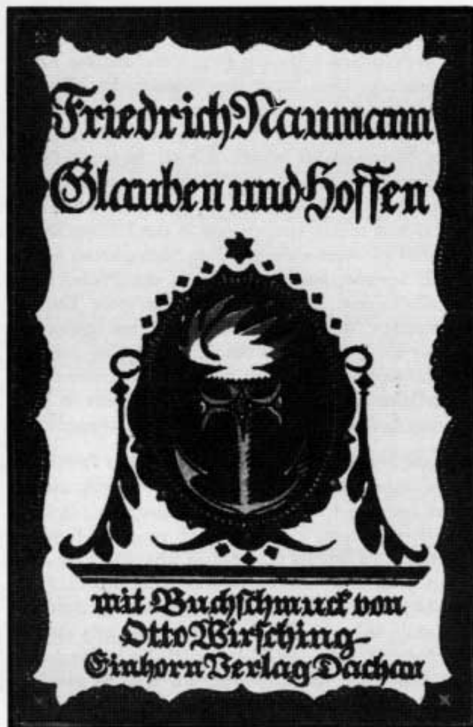
Abb. 1: Otto Wirsching: Buchschmuck zu Friedrich Naumanns »Glauben und Hoffen« (Holzschnitt).