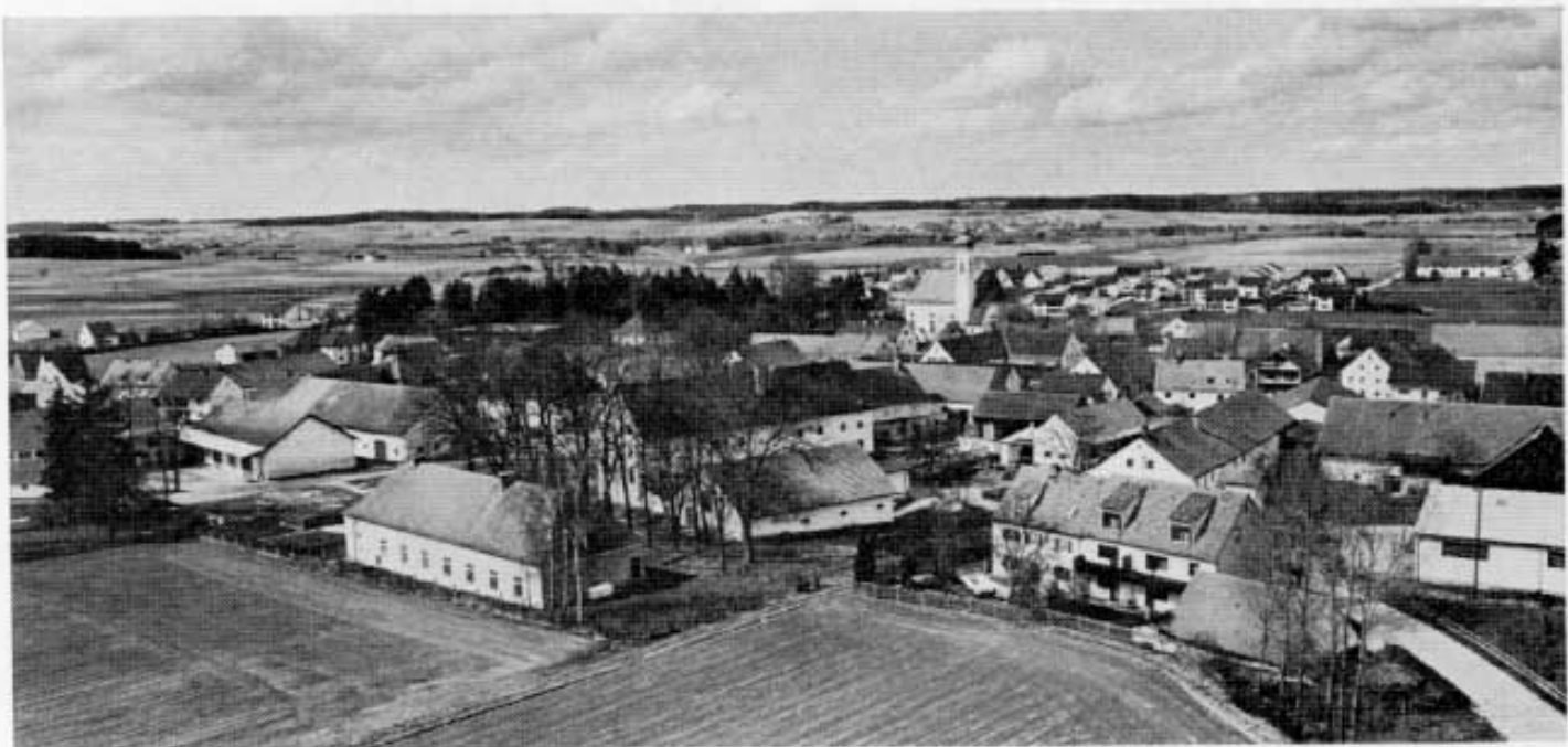
Ortsbild von Vierkirchen, vom Wasserturm zum Glonnal zu gesehen.