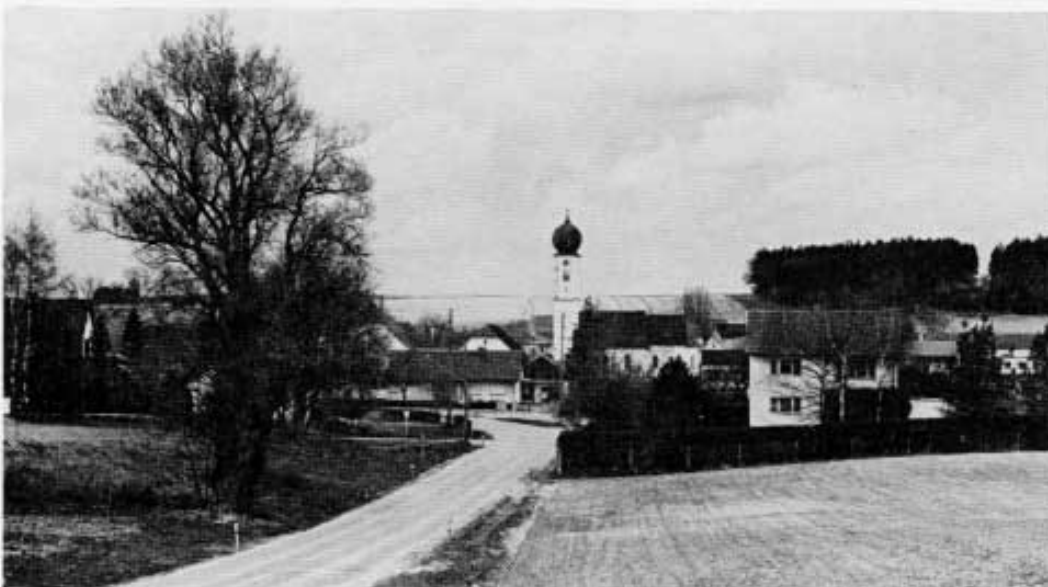
Dorf und Kirche Biberbach.

Anschrift des Verfassers: Josef Wagner, Freisinger Straße, 8061 Vierkirchen.