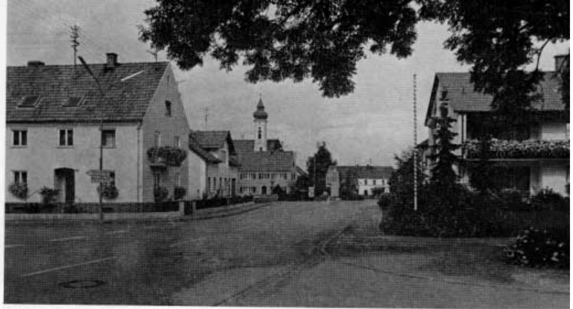
Zentrum von Vierkirchen mit Kriegerdenkmal.