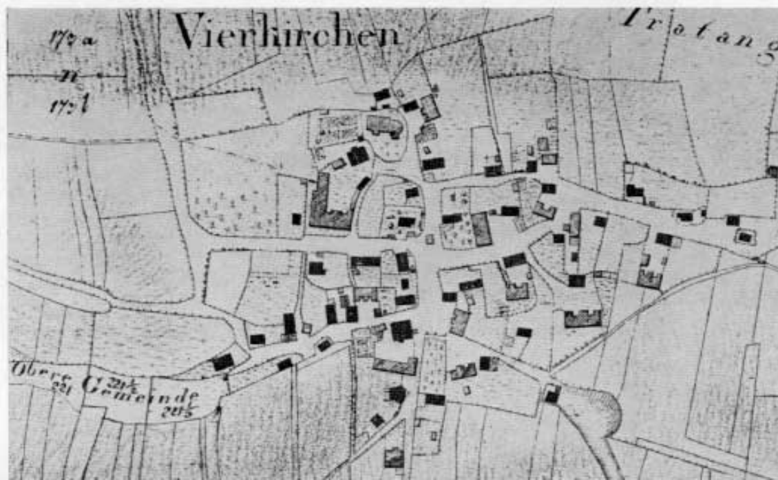
Katasterplan von Vierkirchen von 1809 aus dem Bestand des Vermessungsamtes Dachau. Maßstab 1 : 5 000.

Rohstoffe wurden bis 1950 in unserem Raum nur in kleinen Mengen gebraucht und mußten früher ohne Maschinen mit Ochsen- und Pferdegespann herbeigeschafft wer-