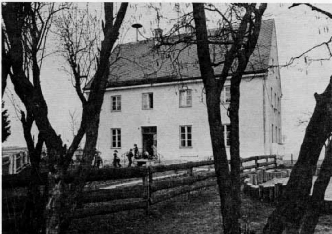
Volksschule in Biberbach.

Seit Ostern 1945 war das Schulzimmer zweckentfremdet für die Unterbringung heimatvertriebener Oberschlesier und Wiener. Am Sonntag, den 29. April 1945, war der schwärzeste Tag für das Biberbacher Schulhaus. Beim Einmarsch der Amerikaner (siehe oben) brannte das Schulhaus bis auf die Außenmauern nieder. Dabei wurde die gesamte Schuleinrichtung und der wertvolle Bestand an Lehrmitteln und Büchern vernichtet. Für ein halbes Jahr blieb der Schulbetrieb unterbrochen. Eineinhalb Jahre