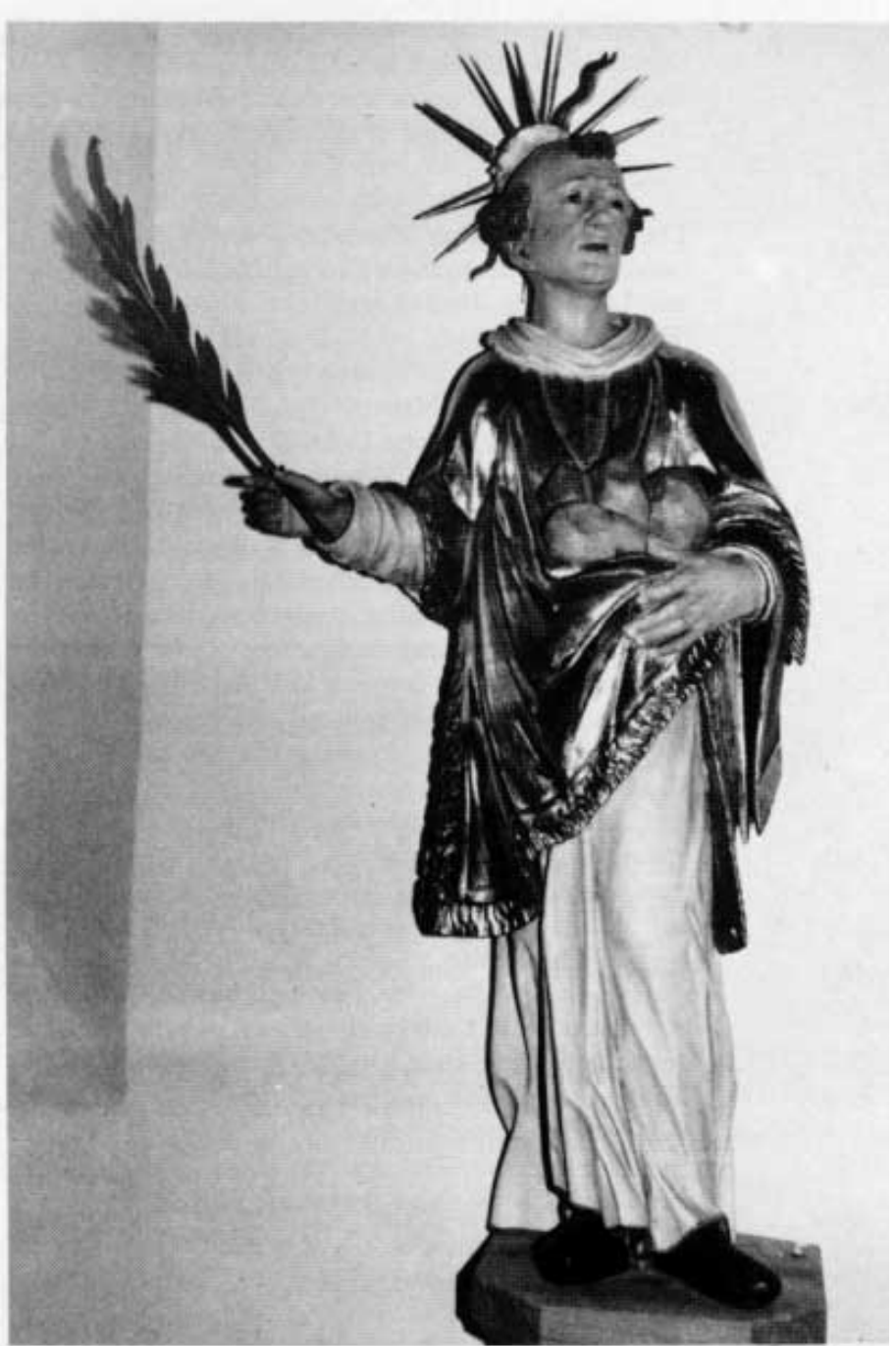
Stephansfigur in der Pfarrkirche von Reichertshausen.

Die Pfarrkirche von Reichertshausen stammt in ihrem jetzigen Umfang im wesentlichen aus dem Umbau von 1851/54. Reichertshausen hatte von 1862 bis 1968 eine