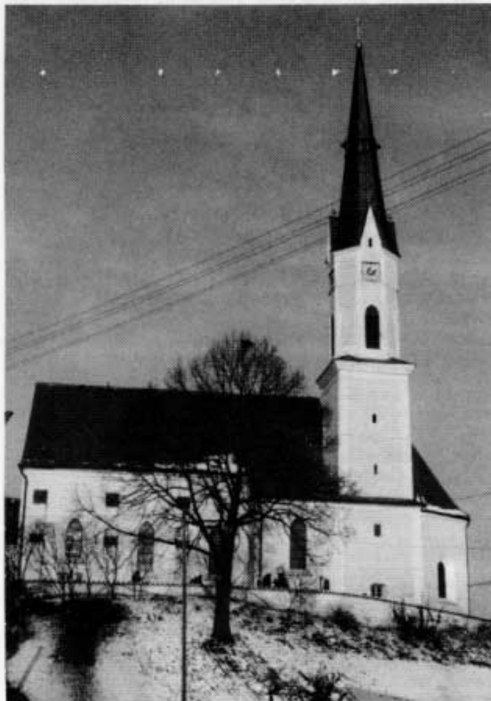
Pfarrkirche von Reichertshausen von Süden.