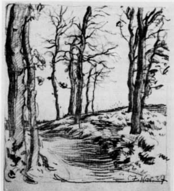
Abb. 4: Karl Trautmann: Spaziergang-Skizze (1937).

Aber seine eigenartigsten Leistungen liegen auf dem Gebiet des Städtebildes und des so selten geübten Interieurs. Als Städtemaler ist er denn auch zu der im Oktober 1947 in München stattgehabten Ausstellung »Die Stadt« zugezogen gewesen, als solcher wird er in die Kunstgeschichte eingehen. Es existieren von ihm vorzügliche Darstellungen von Bruck (im Besitz der Stadt). Besonders bieten auch seine Interieurs, die in der Genauigkeit ihrer Durcharbeitung nicht zu übertreffen sind.