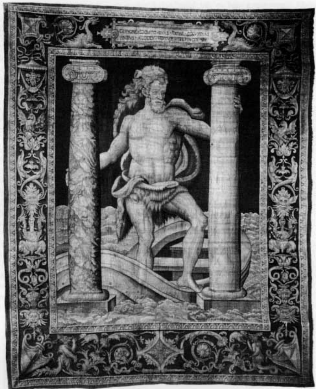
Wandteppich: Herkules errichtet die Säulen bei Gibraltar, in der Residenz München, Akademie der Wissenschaften.