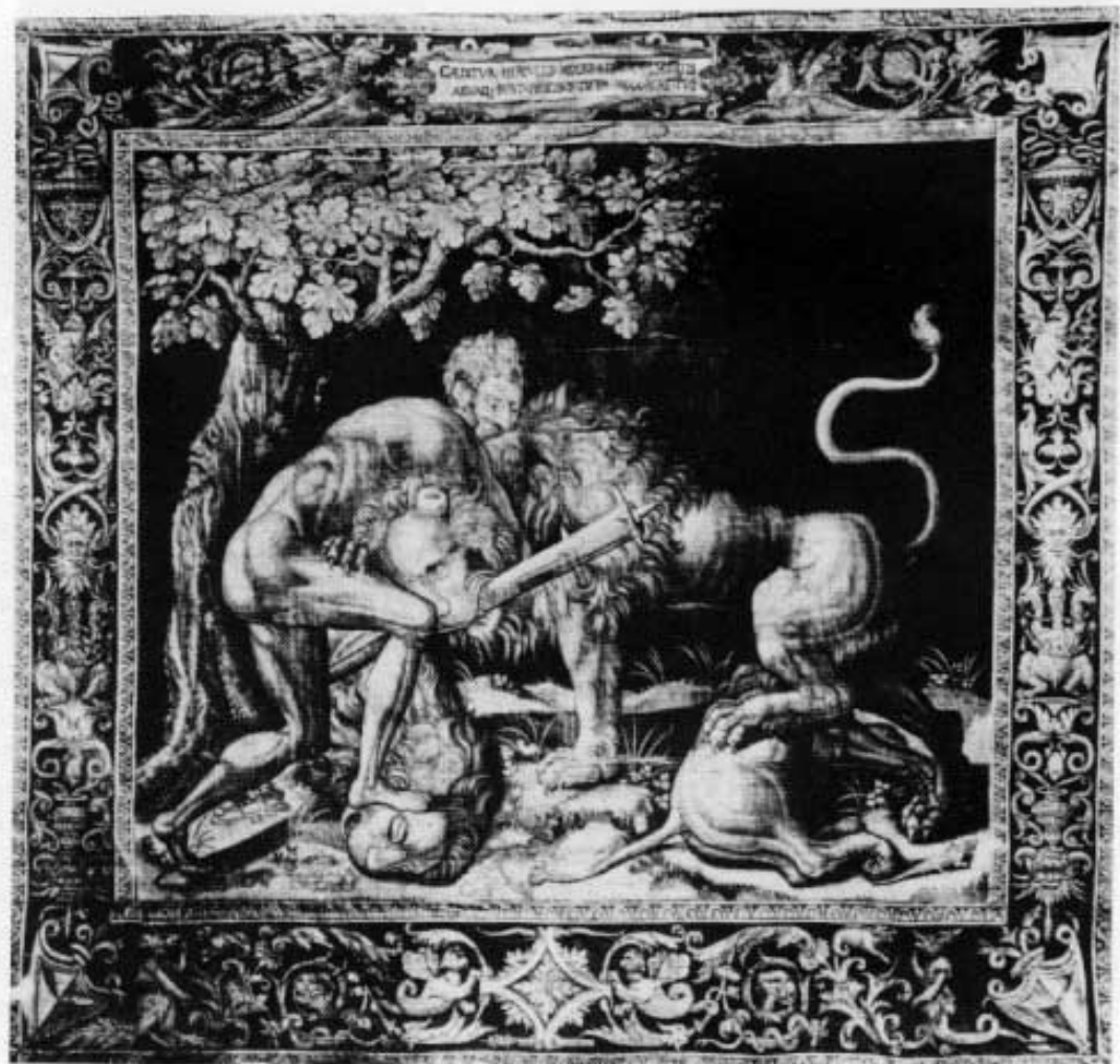
Wandteppich: Herkules Kampf mit dem Nemeischen Löwen, in der Residenz München, Neuer Herkulesaal.

Der gemalte Fries unterhalb der Holzdecke zeigt auf grünlichem Grund in gelbgrauen Farben Gestalten aus der antiken Mythologie. Er stammt von Hans Thonauer d. Ä. (auch Donauer genannt), dessen Ansicht von Dachau im Antiquarium der Münchner Residenz als älteste Ansicht des ursprünglich vierflügeligen Renaissance-Schlusses gilt. Die Fenster hatte der Münchner Glasmaler Hans Heben-