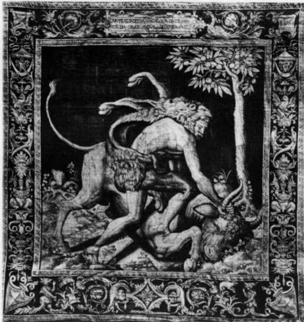
Wandteppich: Herkules Kampf mit dem in einen Stier verwandelten Flußgott Acheloos, in der Residenz München, Neuer Herkulesaal.

Dort also hatte Herkules, Sohn des Zeus und der Alkmene, dem sein Vater die Gabe unbezwingbarer Stärke verliehen