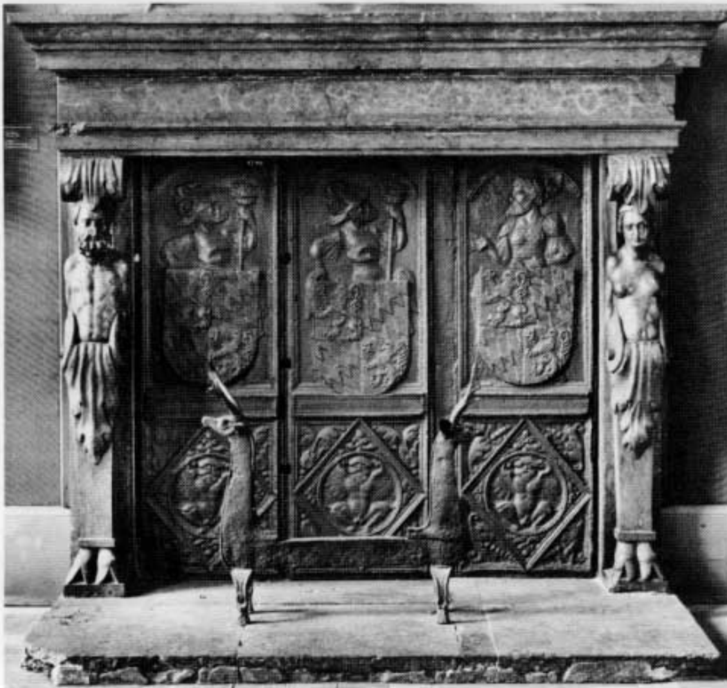
Der aus dem Dachauer Schloßsaal stammende Kamin; jetzt im Saal 22 des Bayerischen Nationalmuseums in München.

Der Neue Herkulesaal wurde als Fest- und Konzertsaal am 3. März 1953 festlich eröffnet und befindet sich an der Stelle des zerstörten Thronsaales im Klenzseschen Festsaalbau der Residenz. An seinen Wänden hängen zehn Teppiche der Dachauer Herkulesfolge, zwei weitere Behänge