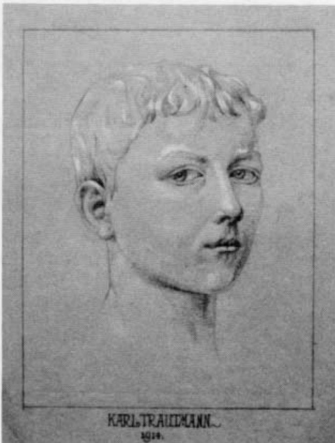
Abb. 1: Karl Trautmann: Selbstbildnis (1914). Bleistift mit Weißbühnung auf grauem Papier, 18,3 x 28,5 cm.

Möglich, daß Leistungen solcher Art dem jungen Trautmann den Zugang zur Kunstgewerbeschule in Nürnberg erwirkt haben, denn er erhält ein Stipendium und tritt in