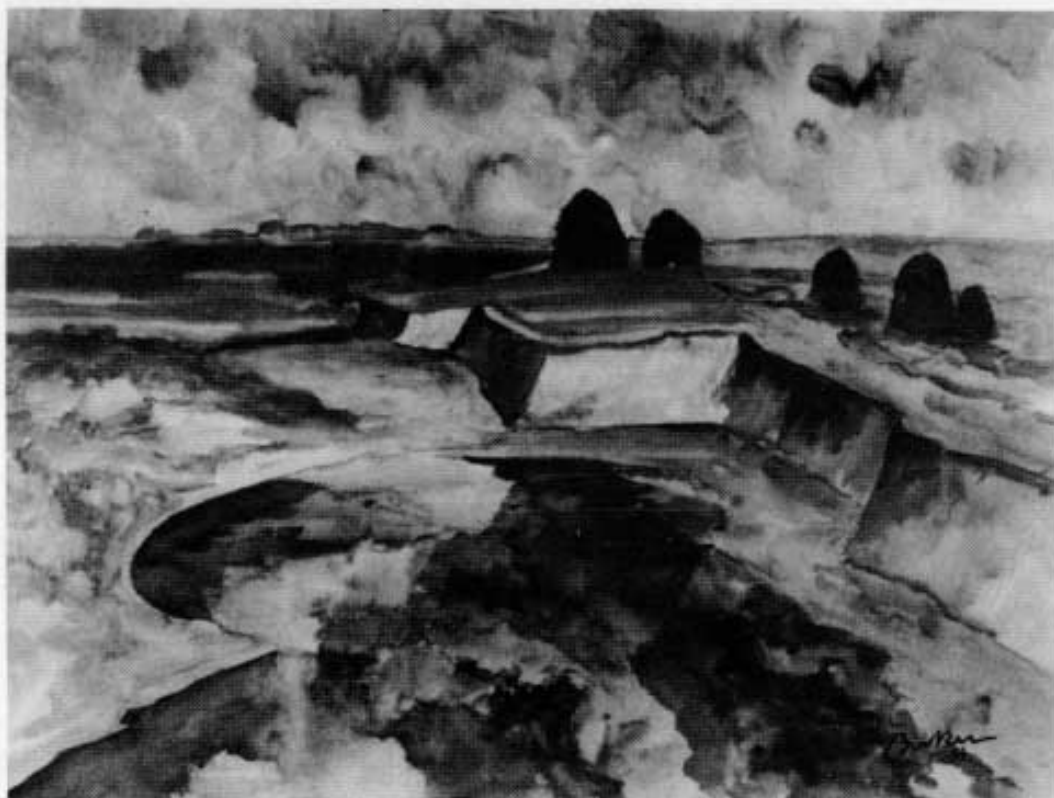
Abb. 2: Hermann Böcker: Ostfriesisches Moor. Aquarell.