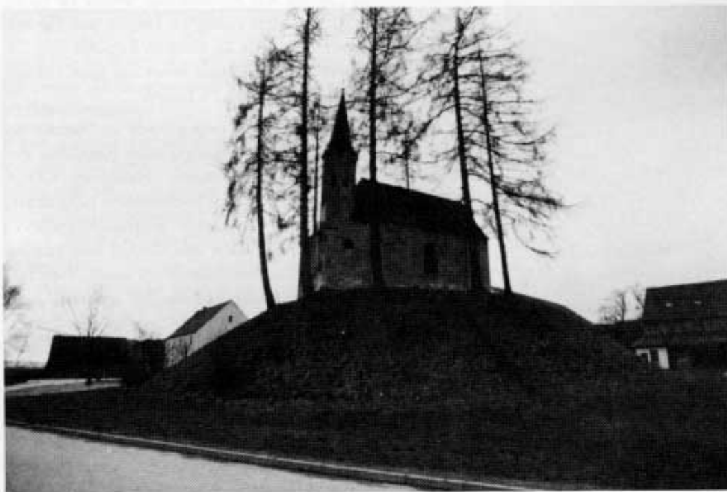
Der Turmhügel in Althehnenberg im Zustand des Jahres 1977.

Nachdem nun endgültig feststeht, daß der Turmhügel nicht in die Zeit der Römer zurückreicht, müssen wir uns einer jüngeren Zeitperiode zuwenden. Hier stoßen wir ab ca. 800 im fränkischen Reich, vor allem in den Rheinniederungen und in Nordfrankreich, auf runde, ovale und auch auf rechteckige und quadratische künstlich aufgeworfene Hügel, welche in der Regel mit hölzernen Türmen und kleinen Nebengebäuden versehen waren und als Schutzbauten errichtet wurden. Die Forschertätigkeit über diese Hügel setzte verhältnismäßig spät ein. Als einer der ersten beschreibt der Franzose de Coumont 1851 diese Hügel. Er nannte sie Chateau a motte, eine Bezeichnung die am besten mit Hügelburg wiederzugeben ist. Diese Benennung hat sich allgemein eingeführt, sodaß nun die künstlichen Hügel Motten genannt werden. Die weiteren Forschungen setzten nur zögernd ein, führten aber zu überraschenden Ergebnissen. In Oberfranken z. B. wurden in letzter Zeit an die 45 festgestellt, davon 29 runde oder ovale und 16 rechteckige Anlagen. Die obere Kronenbreite liegt zwi-