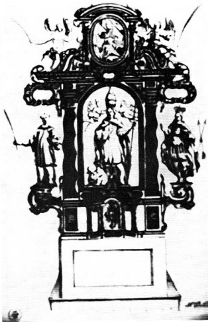
Mittelstetten, Altarentwurf von Lorenz Luidl 1682.