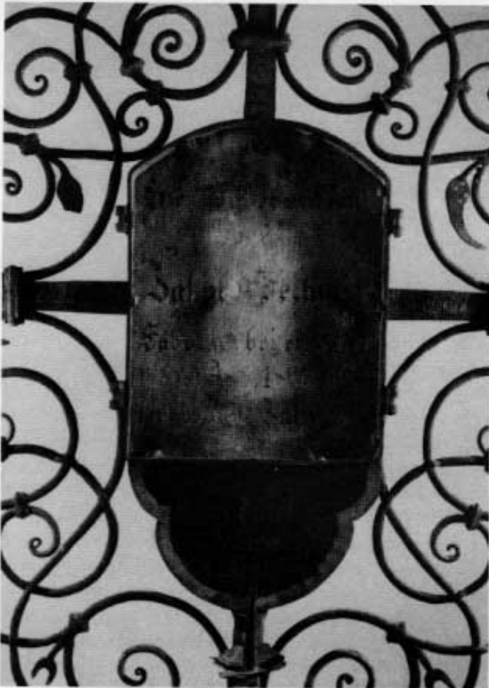
Ausschnitt aus dem schmiedeeisernen Grabkreuz von 1668.

Zu den Schätzen des Museumsvereins Dachau gehören eine Anzahl handgeschmiedeter Grabkreuze. 1668, als das Grabdenkmal auf unserem Bild entstand und im alten Friedhof an der Gottesackerstraße seinen Platz fand, blieb bestimmt nicht jeder Besucher staunend davor stehen, um seine Schönheit zu bewundern — es gab zu viele davon. Bis wir es als Ausstellungsstück des Museums wieder vor uns haben und betrachten können, sehen wir uns die hohe handwerkliche Kunst des Schmiedes auf dem nebenstehenden Bild an und lassen uns die Geschichte der Menschen erzählen, die mit dem Kreuz in Verbindung standen.