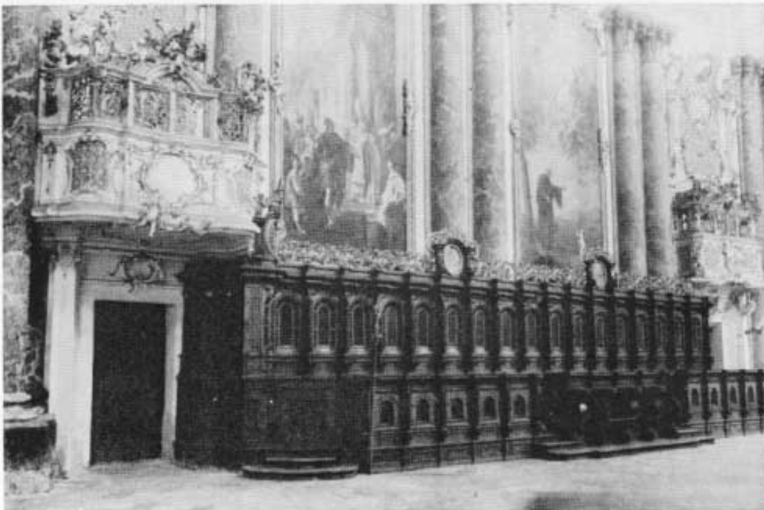
Abb. 3: Chorgestühl in der Klosterkirche Fürstenfeld.