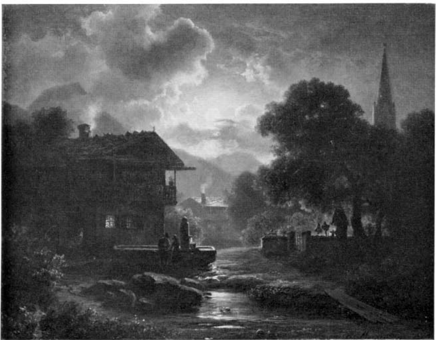
Abb. 5: Christian Morgenstern: Mondnacht in Partenkirchen (Spätwerk) . Öl, 33 x 42 cm. Besitzer: Bayer. Staatsgemäldesammlungen, München.