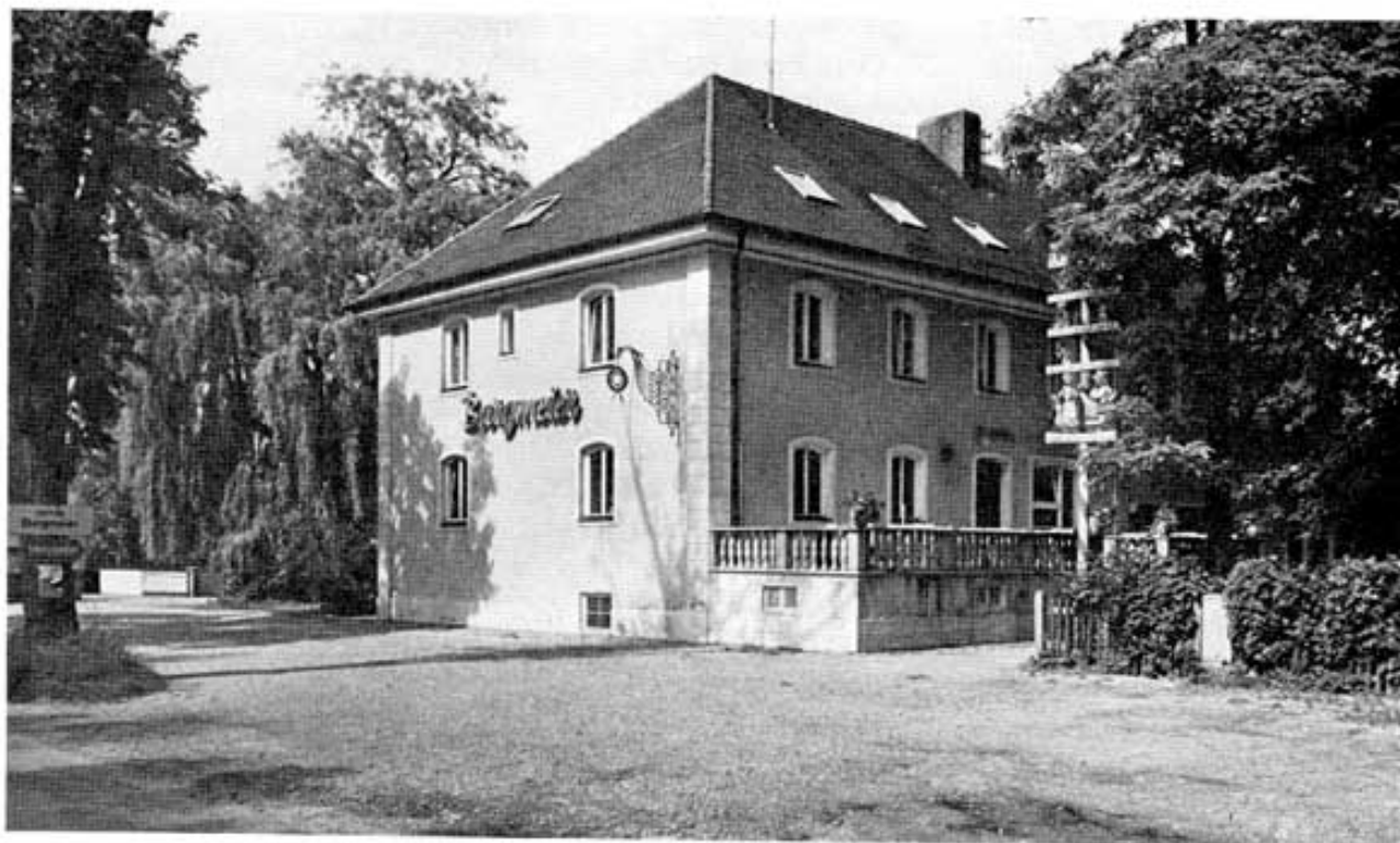
Abb. 6: Das alte Etzenhauser Forsthaus im heutigen Zustand als »Hotel Burgmeier«.