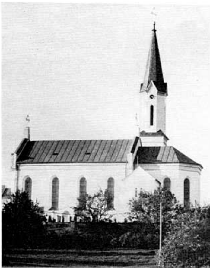
Abb. 1: Südansicht der vor 110 Jahren erbauten Pfarrkirche von Wolfersdorf.

Als dann 1869 die neue Kirche nördlich der alten im Rohbau fertiggestellt war, ließ sich der Abbruch der Schloßkirche nicht aufhalten. »Die Gruft wurde zugeschüttet, die Grabdenkmäler und die Gedenktafeln wurden größtenteils zerschlagen und in den Bauschutt geworfen. Nur die drei großen schönen Gedenksteine, die in die Kirchenwand eingemauert sind, hat Herr Pfarrer Dr. Streber vor dem Untergang gerettet. Sie waren auch bereits weggegeben und einer davon diente beim Schäffler als Vorlage vor dem Brunnen« 17 . Nur die alten Figuren 18 und die Orgel wurden in den Neubau übernommen, wobei letztere auch nicht mehr erhalten ist.