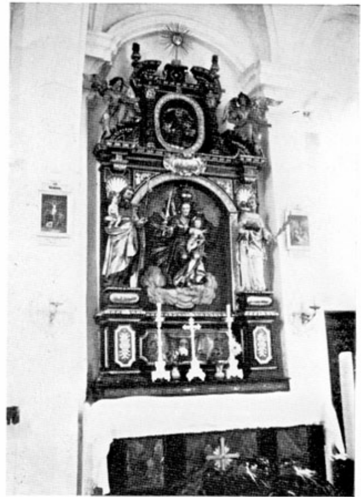
Abb. 4: Ehemaliger rechter Sünzhausener Seitenaltar, der seit 1914 in St. Maximilian bei Kraiburg am Inn aufgestellt ist.