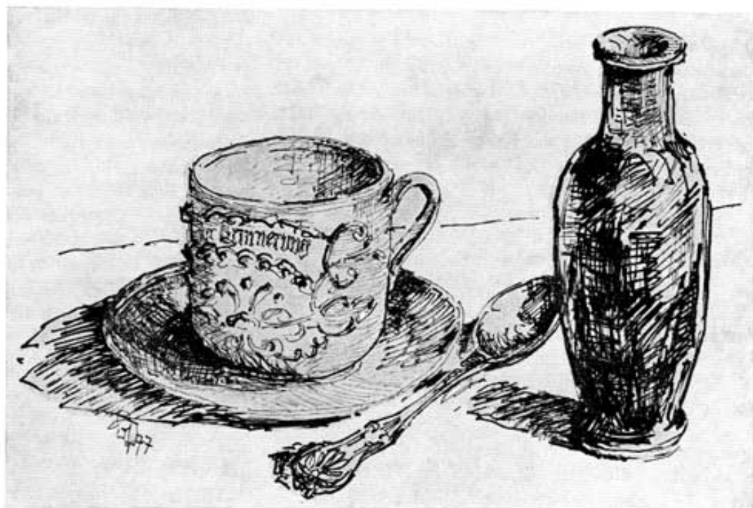
Tasse, Löffel und Vase aus dem Glaskasten der »gspierten Kammer«.

der Ehre wert geachtet, ein Hochzeitsgeschenk zu sein. Teller und Tasse sind glänzend glasiert und poliert und erfreuen sich einer seltenen Farbe zwischen Süßlila und Rosa. An den Seitenfronten schmücken sie phantasievolle Applikationen: Ranken, gelappte Blätter und vergoldete Wellenlinien um ein weißes Feld bekunden, in Goldschrift aufgemalt, mit altmodischen Lettern: »Zur Erinnerung«. Behäbig sitzt die Tasse in ihrer Untertasse. Auch der Henkel entbehrt nicht der Vergoldung. Das vordere