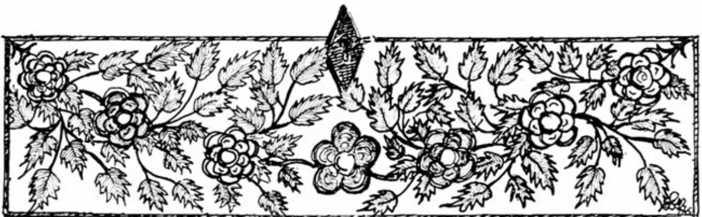
Abb. 3. Bemalte Stirnseite einer Truhe aus dem Amperland. Zeichnung von Rektor Peter Blab, Eichenau.

In seiner köstlichen Weihnachtslegende »Heilige Nacht« läßt Ludwig Thoma das »Heilige Paar«, freilich vergeblich, zu später Stunde, in Bethlehem beim Vetter Josias um Quartier bitten. Ja, der Zeichner Wilhelm Schulz verlegte sogar, wie unschwer nachweisbar war, die Herbergssuche nach Alt-Fürstenfeldbruck 1 in damals noch