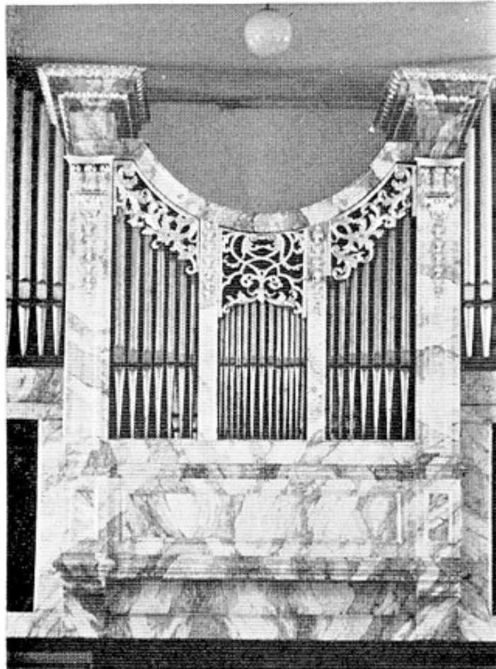
Regenceprospekt in Unterbachern aus der Zeit um 1735.

Das Brüstungswerk von Max Maerz (München) opus 75 aus der Zeit um 1867 1 stand ursprünglich in der Kirche Unterbrunn. Graf v. Spreti erwarb die Orgel 1912 für Unterweilbach 2 , da Willibald Siemann (München) damals für Unterbrunn ein neues Werk erstellte 3 .