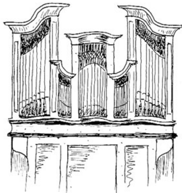
Orgelprospekt in Weichs.