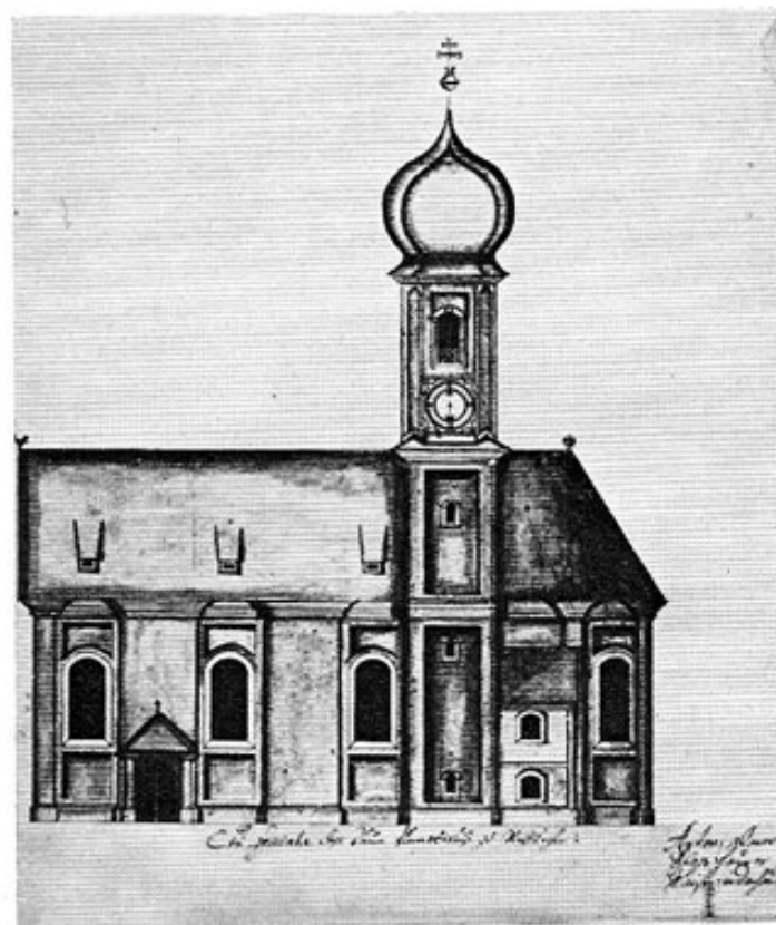
Pfarrkirche Vierkirchen, Südansicht, Aufriß von Anton Glonner 1753.