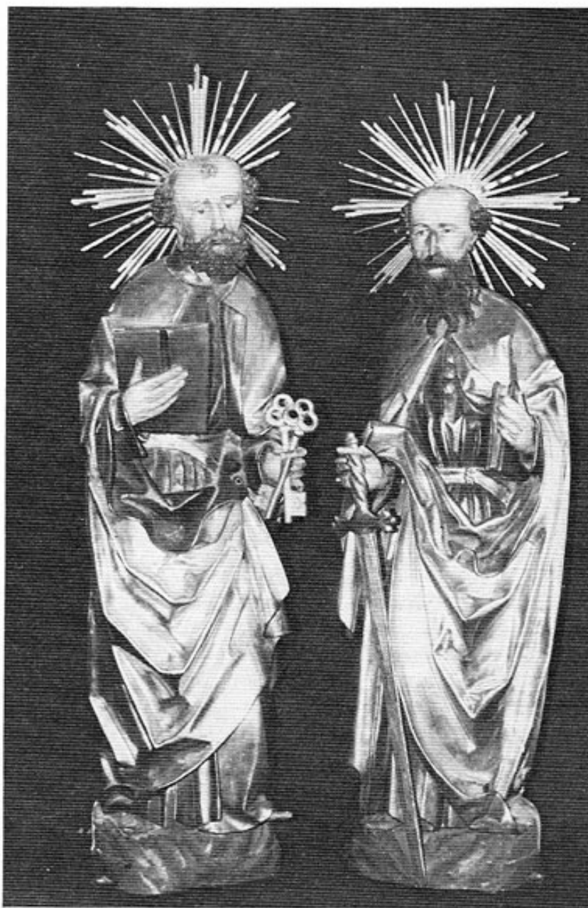
Die kostbaren gotischen Figuren der Apostel Peter und Paul, die 1976 wieder aufgestellt werden sollen.