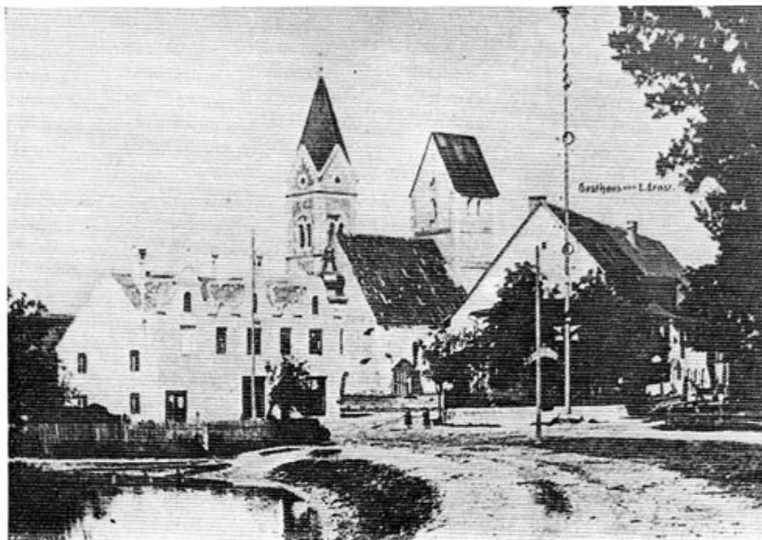
Um die Jahrhundertwende hatte Olching drei Jahre lang zwei Kirchen.

Um die beiden Seitenaltäre aus der Spätrenaissance sowie um die Kanzel bewarb sich dann erfolgreich Eggkofen bei Neumarkt. Kaufpreis: je 200 und 100 Mark ergab 500 Mark. Zum Glück war ihnen der Hochaltar für ihre Kirche zu