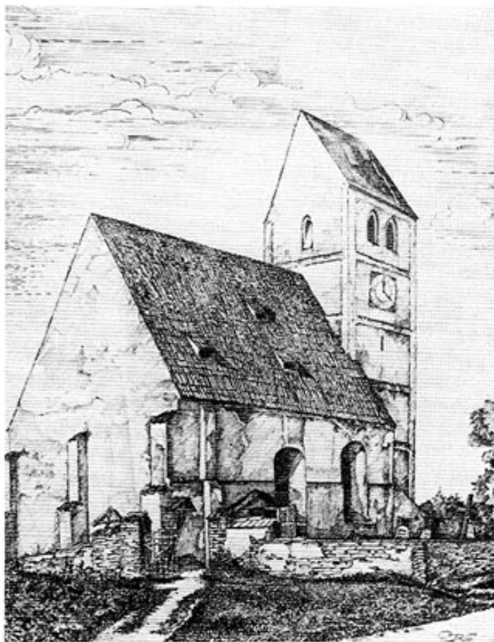
Das alte Gotteshaus in Olching nach einer Federzeichnung von Rektor a. D. Rudolf Bögel.

Immer waren es die Pfarrerherren von Emmering, die sich für die Erhaltung ihrer Filialkirche einsetzten. Sie hielten dort bisweilen Gottesdienste, später aber auch Patres vom Kloster Fürstfeld und die Benefiziaten von Eting. 1562 wird der Zustand des Gebäudes vom Dachauer Gerichts- schreiber als »gar paufellig« bezeichnet und von Repara- turen, »die von neten sind«, berichtet. »Dieweil aber khain Gellt vorhanden«, erbaten sich die »Pröbste« vom Dach-