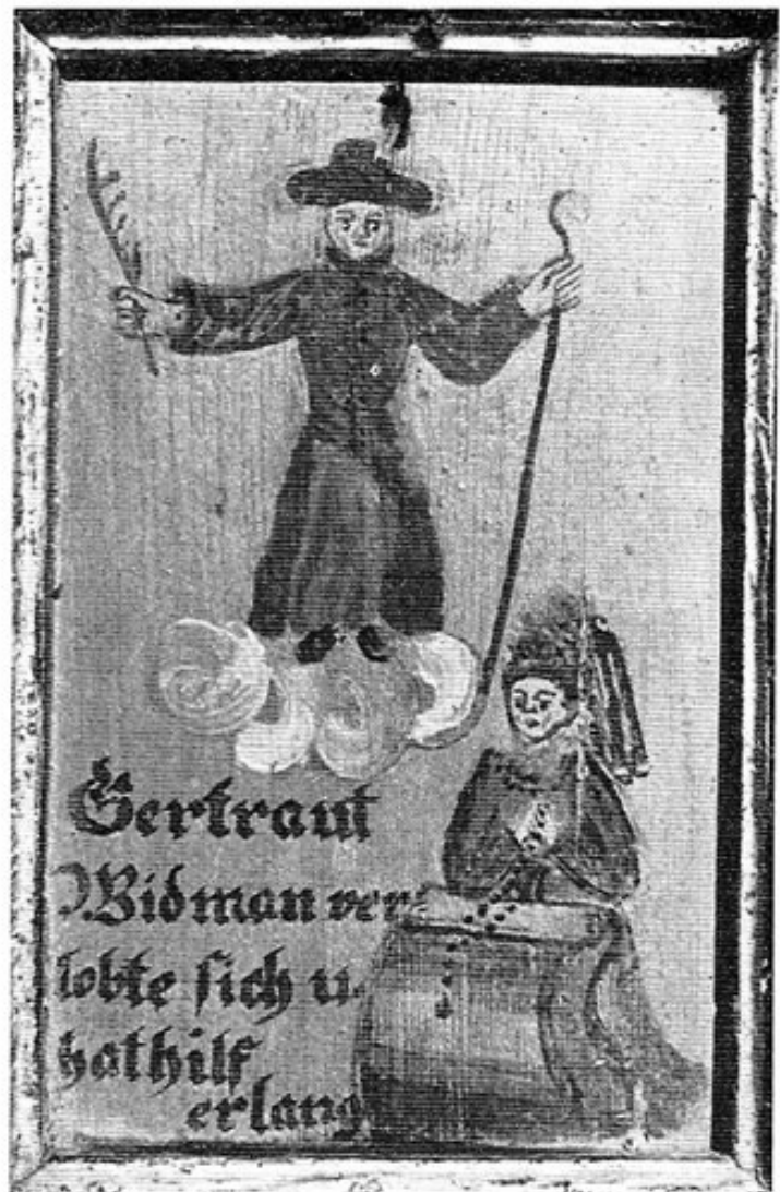
Abb. 4: Undatierte Votivtafel aus der Sebaldi-Kapelle bei Helfenbrunn.

heiligen führt, kann nur ganz vage beantwortet werden. Vielleicht hat das Prämonstratenserstift Neustift bei Freising, zu dessen Besitz die Pfarrei Kirchdorf a. d. Amper gehörte, über das Prämonstratenserklöster Schäftlarn, dem die in der Pfarrei Deining liegende Wallfahrtskirche St. Sebald in Egling inkorporiert war, das Patronat vermittelt. Die Helfenbrunner Sebaldikapelle hat offensichtlich in der Volksfrömmigkeit eine nicht unbedeutende Rolle gespielt, wie ich bei der Inventarisierung 1971 feststellen konnte. Verschiedene Drucke mit religiösen Motiven, u. a. zwei Stahlstiche, auf denen Christus am Kreuz und die »Arma Christi« und die Legende der hl. Notburga dargestellt waren, hingen an den Wänden. Nischen in der Innenmauer und ein Holzregal waren offensichtlich einst für Votivgaben bestimmt. Eine kleine Sitz- und Betbank wollte die Besucher zu stillem Gebet einladen. Das oben genannte Gitter aus Schmiedeeisen trennte den Altarraum ab. Unten an der Altarmensa befanden sich ein Tafelbild und ein Relief mit der Darstellung der Armen Seelen im Fegefeuer. Die barocken Plastiken der Muttergottes, der hl. Creszentia, des gezeißelten Heilands und des hl. Eberhard von Tüntenhausen standen auf und am Altar. Offensichtlich wurde auch hier Eberhard, der fromme Hirte aus dem nahen Tüntenhausen, das ebenfalls dem Prämonstratenserstift Neustift inkorporiert war, verehrt,