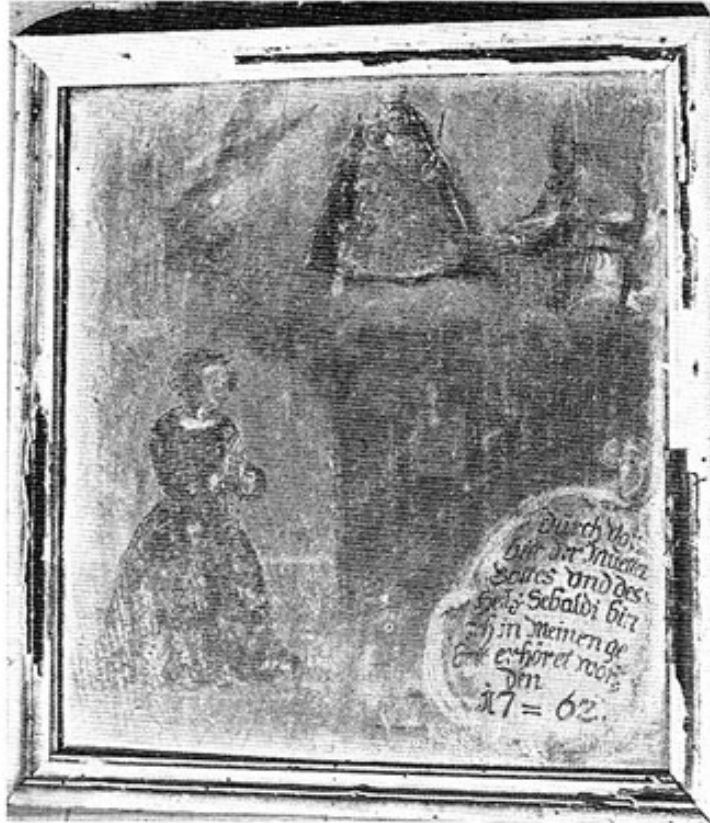
Abb. 3: Votivtafel von 1762 in der Sebaldi-Kapelle bei Helfenbrunn.