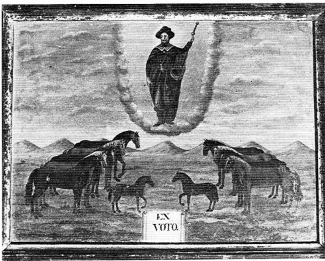
Abbildung 5: Undatierte Votivtafel aus der Sebaldi-Kapelle bei Hel- fenbrunn.