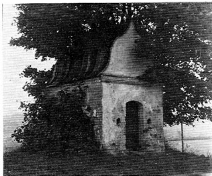
Abb. 1: Die barocke Sebaldi-Kapelle bei Helfenbrunn.

Unser bescheidenes Gotteshaus ist ein Stein des Anstoßes für viele geworden. Es ist nur noch als Omnibushalteplatz nütze. Immer wieder passieren z. T. schwere Verkehrsunfälle, da sich die Kapelle genau an der Straßenkreuzung befindet und die Sicht der Autofahrer erheblich behindert. Somit ist eine große Gefahrenstelle und ein Verkehrshindernis gegeben. Das Urteil des Straßenbauamtes München lautet: »Eine Verbesserung der Sichtverhältnisse an der Kreuzung St 2054/FS 7 kann nur durch Beseitigung der Kapelle oder Verlegung der St 2054 erreicht werden.« Der Abbruch der Feldkapelle wäre natürlich die primitivste und brutalste Lösung des Problems. Die Kosten für eine Verlegung der Staatsstraße auf 700 m belaufen sich auf etwa 150 000.— DM; Mittel dafür sind nicht vorhanden. Der Vorschlag, die gesamte Kapelle in nördliche Richtung zu verschieben, hat sich als undurchführbar erwiesen. Der Abbruch und die Neuerrichtung der Kapelle an einem anderen Ort käme auf rund 24 420.— DM zu stehen. Doch ist dies auch keine klare Lösung, denn die Feldkapelle wurde ganz bewusst an die Kreuzung auf die sanfte Erhebung gestellt, der Baum gehört ebenfalls unbedingt