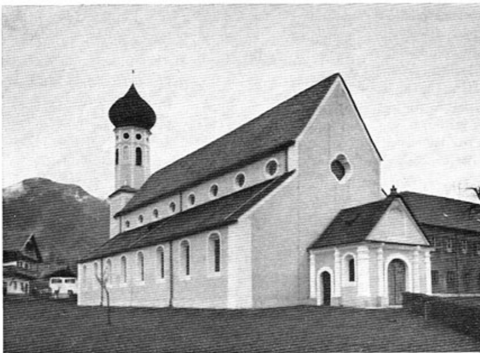
St. Martin in Fischbachau.