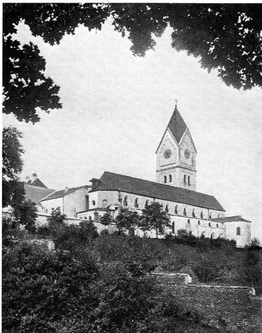
Die Stiftskirche Scheyern.