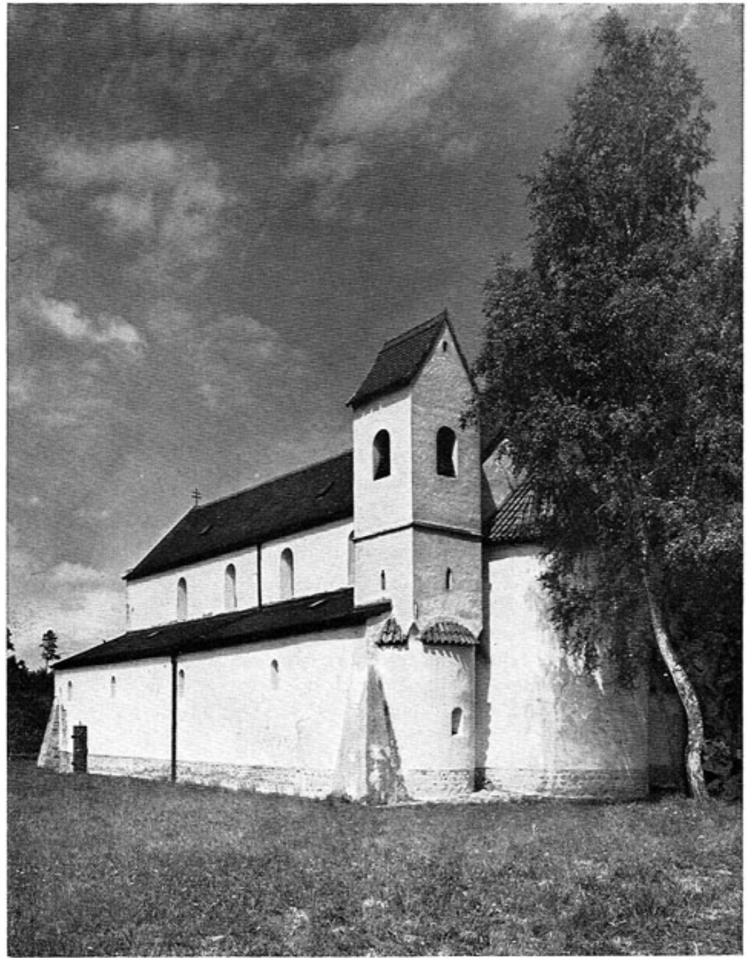
Die romanische Basilika auf dem Petersberg bei Erdweg.