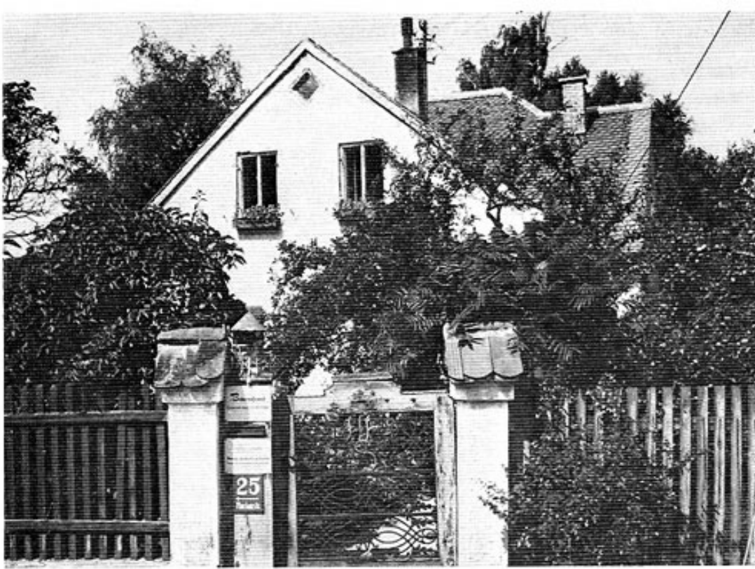
Das Haus des Künstlers in Geiselbullach im heutigen Zustand.