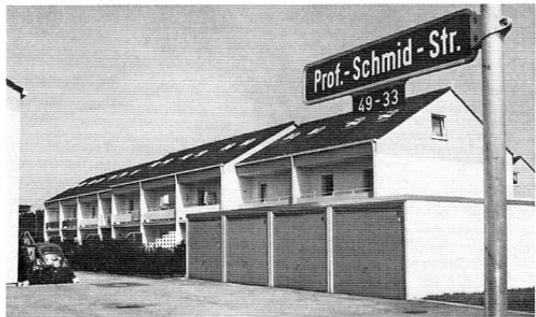
Die nach dem Künstler benannte neue Siedlung in Geiselbullach.