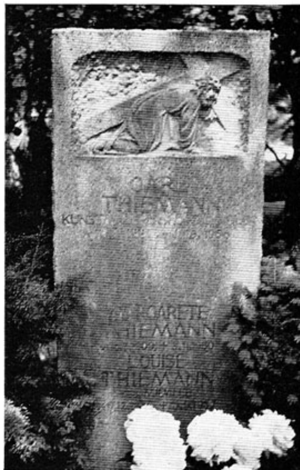
Waldfriedhof Dachau, Thiemanngrab.