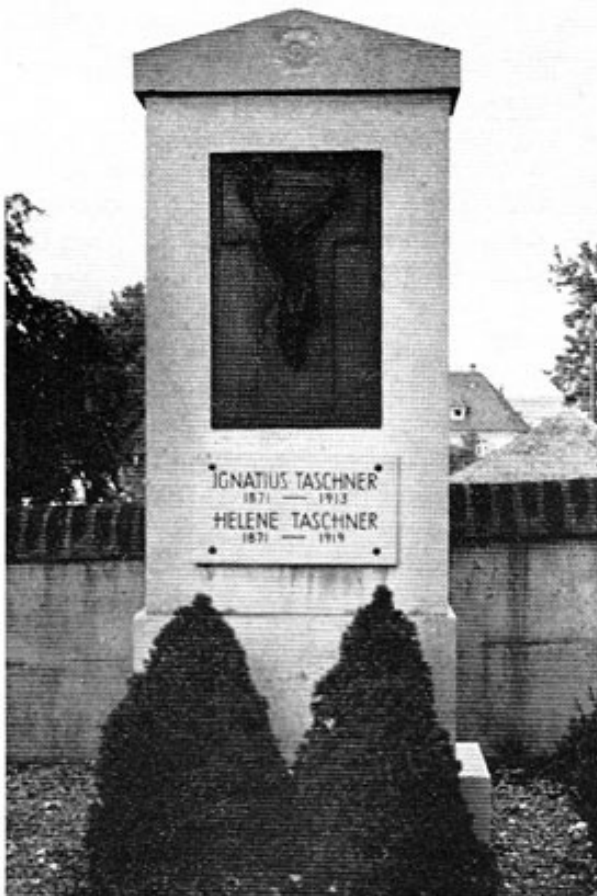
Friedhof Mitterndorf, Taschnergrab.