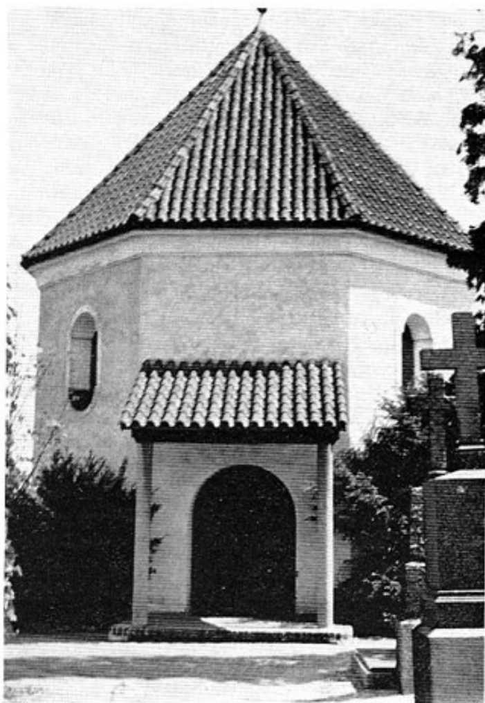
Alte Kapelle (Kriegergedächtniskapelle) im Stadtfriedhof Dachau.