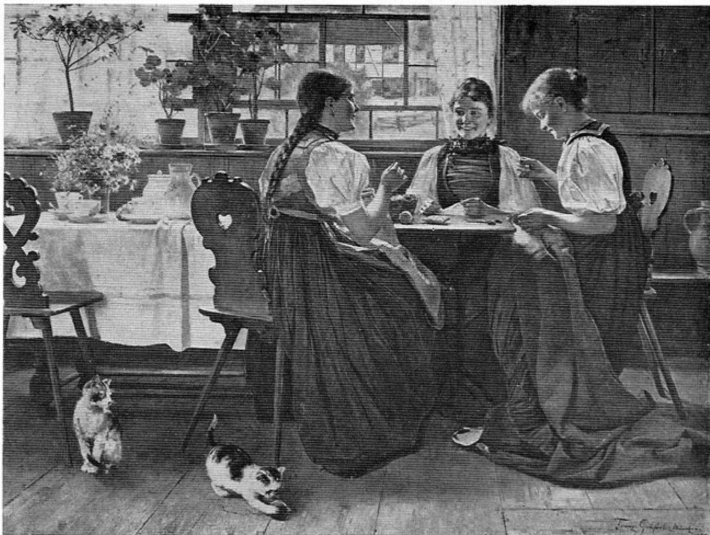
Abb. 1: Prof. Franz Gräsel: Bei der Arbeit (die Schwestern des Künstlers). Öl. Großformat. 1888.

Was es für die Entwicklung der Gemütskräfte des Knaben und seiner sich früh herausstellenden Malerbegabung bedeutet haben mag, auf solch urgesundem Boden aufzuwachsen, ist garricht zu ermessen. Vermutlich hat der Bub schon am heimischen Mühlbach jenen kostbaren Schatz an Beobachtungen gesammelt, der ihn zum Entenmaler prädestinierte, und wurde dort der Grund dazu gelegt, daß