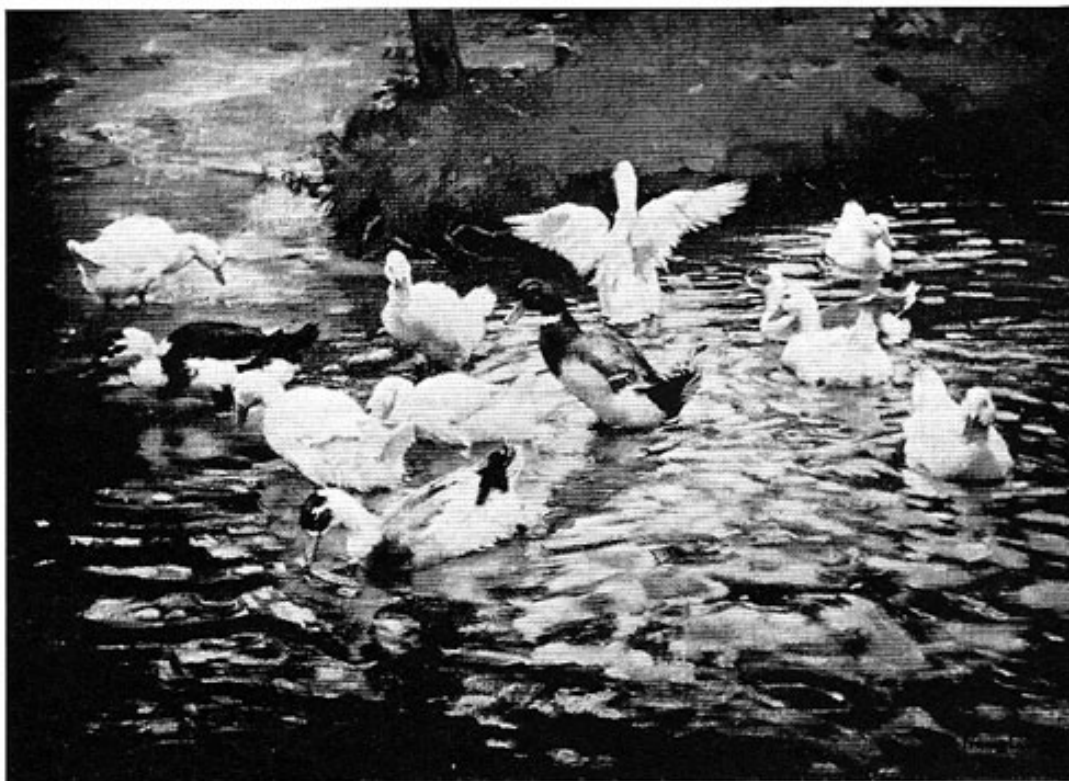
Abb. 6: Prof. Franz Gräfel: Enten im Wasser. Öl. 98,5 x 67,5 cm.

Zwar blieb und wirkte Gräfel in der Hauptsache nun wohl in München, es zog ihn aber auch immer wieder zurück in die heimatlichen Gefilde des Schwarzwaldes. Nach dort gepflogenen einschlägigen Studien entstand nun eine Reihe