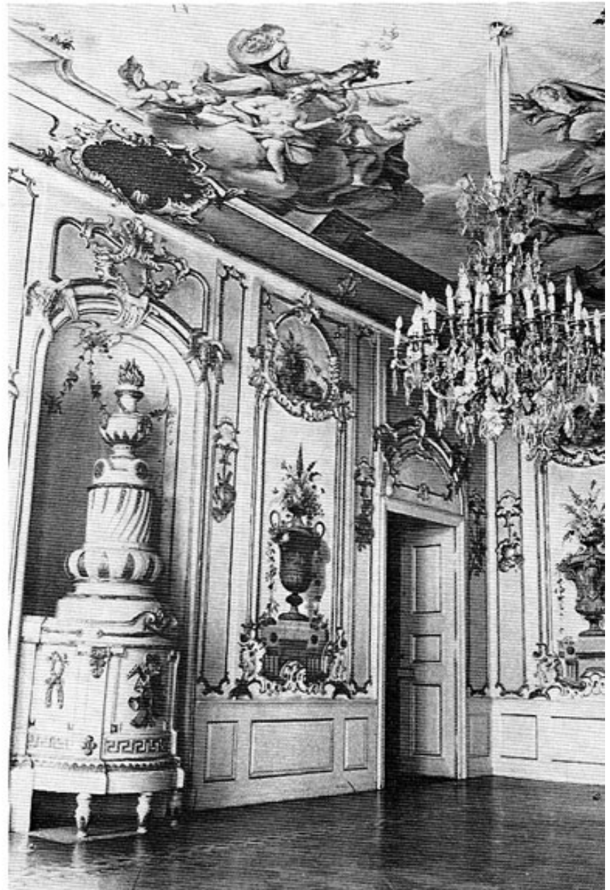
Schloß Haimhausen. Festsaal.

Unter Graf Karl Ferdinand Maria wurde die Schloßanlage einer »umfassenden Erneuerung unterzogen«. Das im Stil einer italienischen Landvilla errichtete Lusthaus wurde durch François Cuvilliés, den Architekten des Kurfürsten, ab 1747 im französischen Geschmack umgebaut. Der Bau Wolffs zeichnete sich durch eine besonders aufwendige Freitreppenanlage an der westlichen Schmalseite aus. Cuvilliés verbreiterte den dreigeschoßigen Bau zunächst an beiden Seiten um drei Fensterachsen. Die ursprüngliche Breite ist durch zwei Ziervasen auf dem Hauptgesims erkennbar. Dann fügte er je einen zweigeschoßigen Flügelbau im rechten Winkel an, wodurch an der Eingangsfront ein kleiner Ehrenhof entstand. Das den Mittelbau zusammenfassende Walmdach betont die horizontale Ausweitung. Die blockförmige Landvilla war in ein »fürstlich« breit und vornehm gelagertes Schloß umgewandelt worden. Eine leichte Zentrierung wird durch den nur wenig vortretenden Mittelrisalit bewirkt, der die drei Mittelfenster zusammenfaßt. Dieser Mittelrisalit ist mit großer Meister-