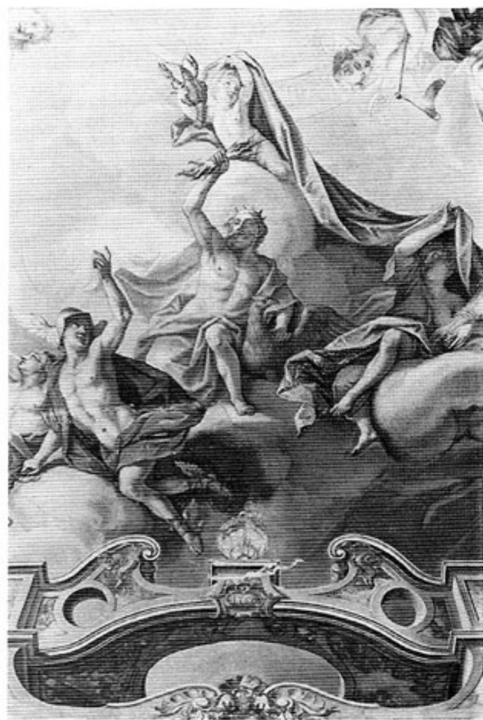
Schloß Haimhausen. Detail des Deckengemäldes im Festsaal von J. G. Bergmüller (1750), »Herbst«.

Dem Schloß sieht man heute nicht mehr seine wechselvolle Geschichte an. Der Wechsel des Platzes hing jeweils eng mit der Funktion des Schlosses zusammen: die befestigte Anlage auf der Anhöhe neben der Kirche als Herrschaftszeichen des Ortsadels; das Wasserschloß an der Amper als Abrücken von der Dorfgemeinde; die Landvilla, umgeben von Gartenkompartimenten, als Symbol