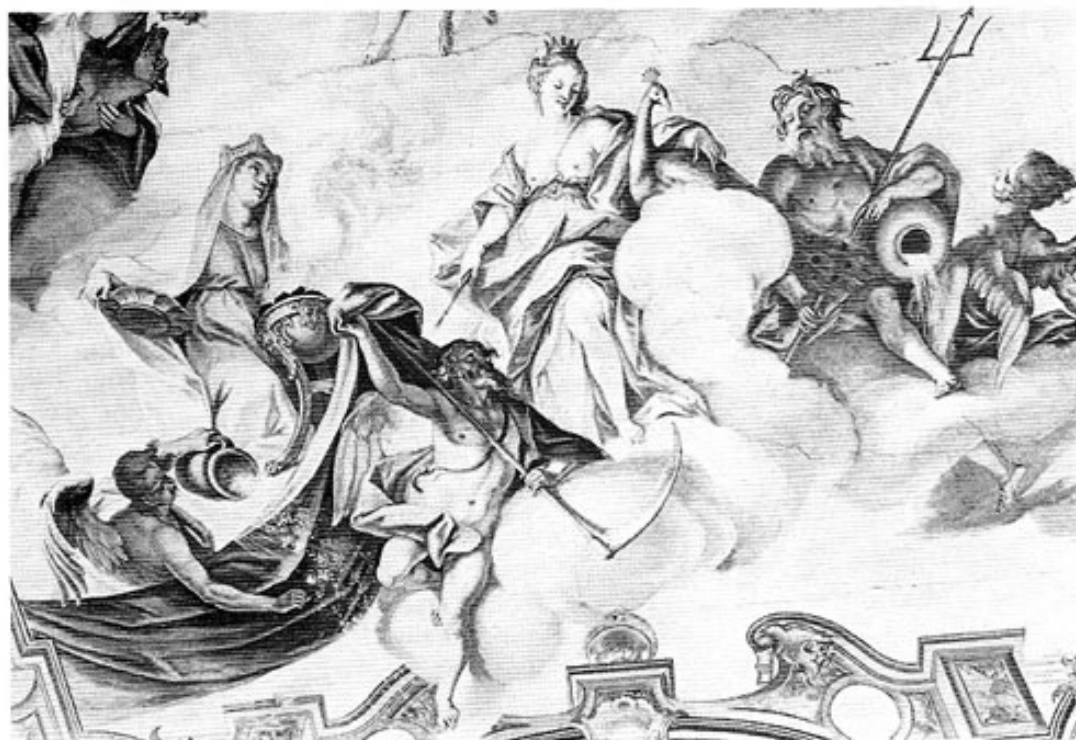
Schloß Haimhausen. Detail des Deckengemäldes im Festsaal von J. G. Bergmüller (1750), »Winters«.

der politischen, wirtschaftlichen und kulturellen Entwicklung; die Umgestaltung des Lusthauses in das eigentliche Schloß als Ausdruck der zu höchsten Ehren im kurfürstlichen Dienst gelangten Grafen von Haimhausen.