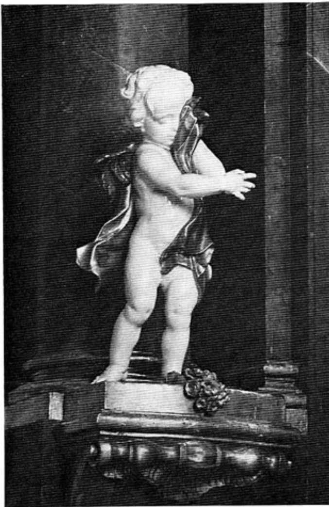
Schloßkapelle Haimhausen. Weinender Putto vom Hochaltar.