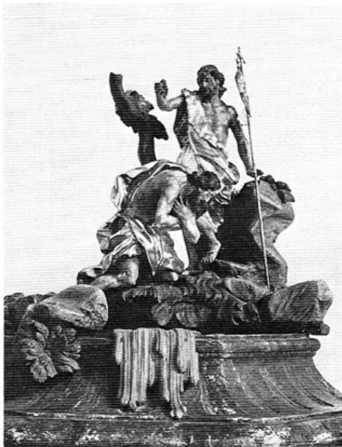
St. Nikolaus in Haimhausen. Taufsteingruppe von Joseph Bonaventura Mutschkele.