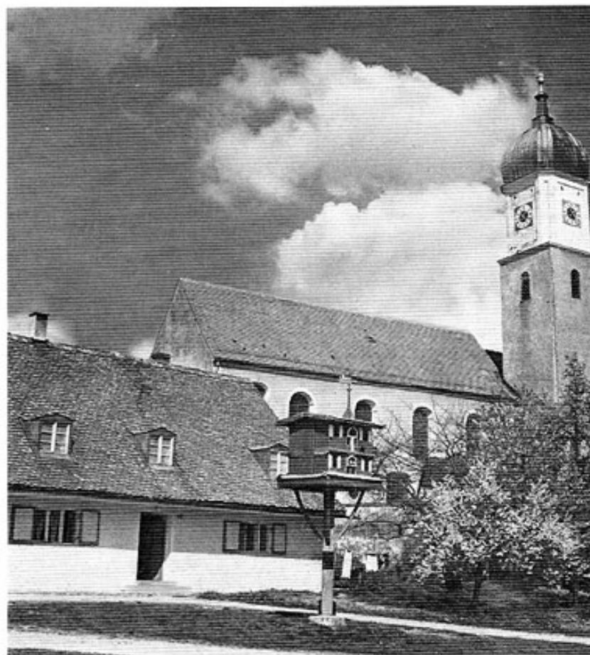
St. Nikolaus in Haimhausen.

Die über den normalen Seelsorgsdienst wie Verkündigungen und Sakramentenspendung hinausgehenden öffent-