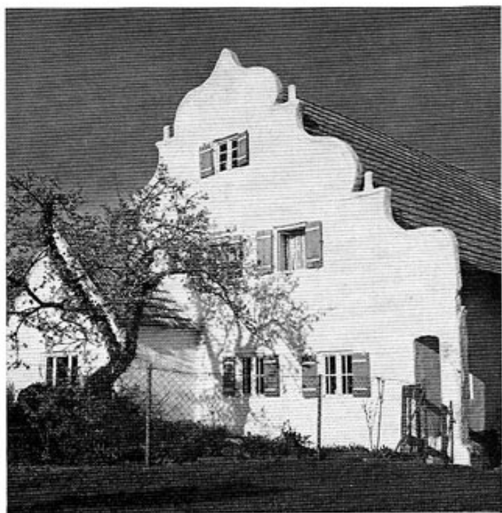
Westerndorf, »beim Mesner«.

Um 1760 gab es in Amperpettenbach ebenfalls 11 Anwesen. Ganzhöfe besaßen die Klöster Weihenstephan (Häuslbauer, Huber), Scheyern (Hums, Koch) sowie