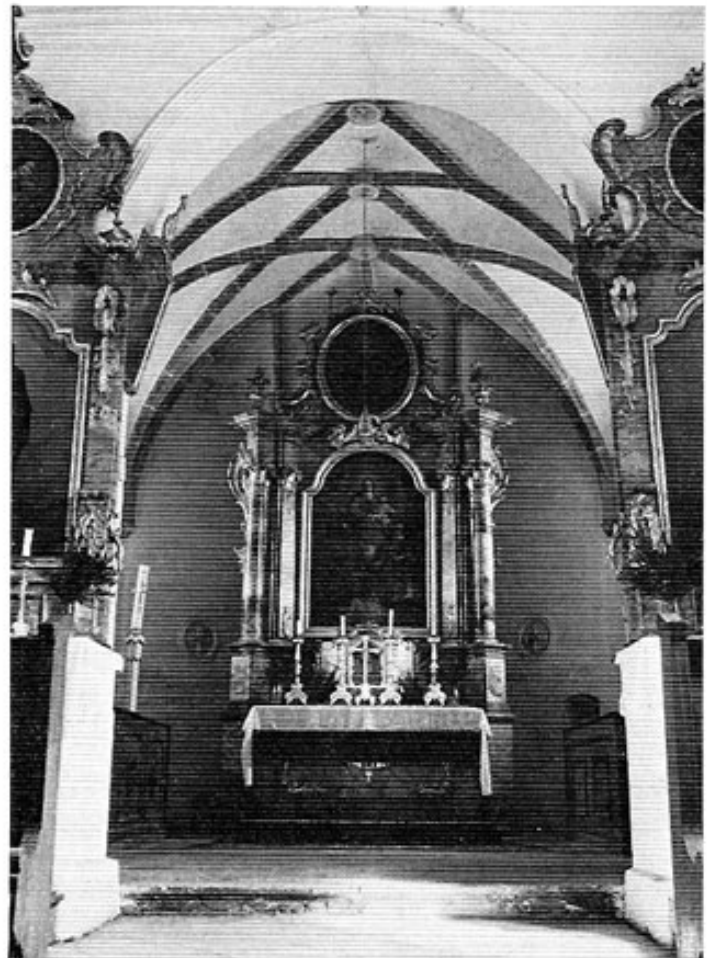
St. Jakob in Ottershausen. Altarraum mit gotischem Netzgewölbe.