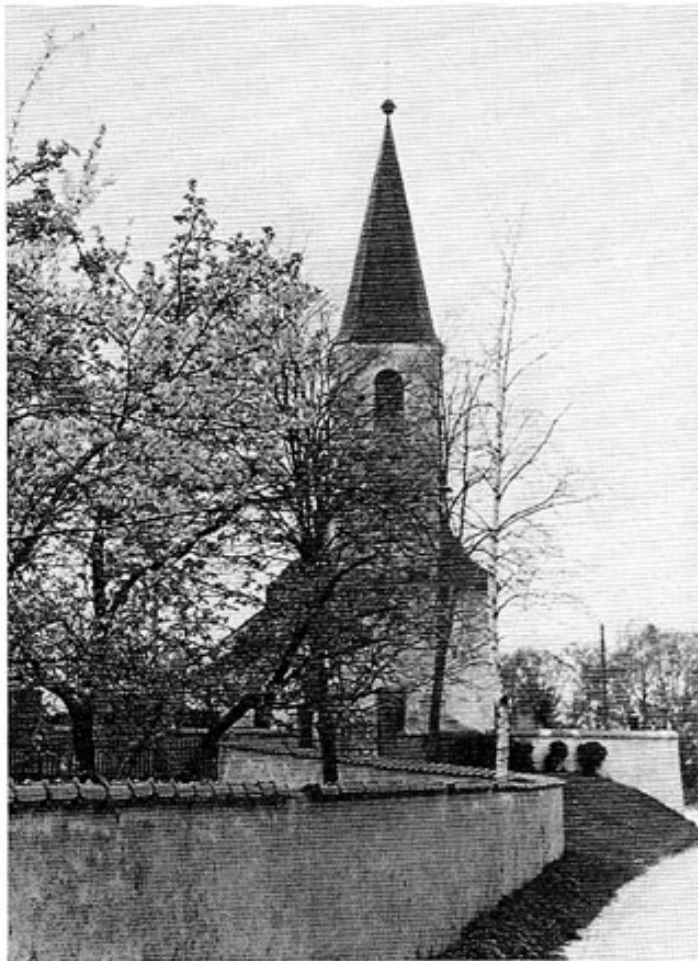
St. Jakob in Ottershausen.

Um 1500 gab es 16 Anwesen in Ottershausen. Je ein Hof gehörte nach Weihestephan und zum Kloster Scheyern. 1760 waren es 21 Anwesen. In den Händen des Hofmarksherrn lag das Obereigentum von fünf \frac{3}{4} -Höfen (Häuslmayr, Kollerer, Wildmooser, Egermayr, Westl), einem \frac{1}{2} -Hof (Ballauf), einer Bausölde (Hörger) und zehn Leersölden. Zur Kirche Inhausen gehörte eine Bausölde (David) und zur Kirche Ottershausen ebenfalls eine Bausölde (Mesner) sowie zwei Leersölden. Die Gemeinde besaß das Hüthaus.