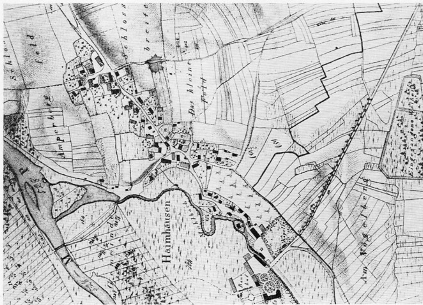
Haimhausen im Jahre 1810. (Ausschnitt aus dem im Vermessungsamt Dachau verwahrten Original-Katasterplan.)