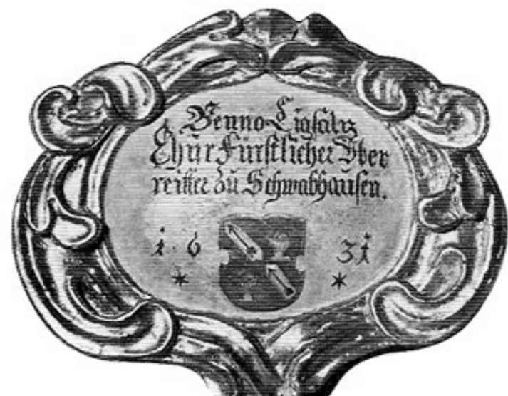
Widmungstafel an dem von Benno Ligsalz gestifteten Kruzifix mit dem alten Ligsalz wappen. Bei einer Renovierung wurde die ursprüngliche Jahreszahl 1681 in 1631 verändert.