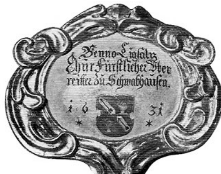
Widmungstafel an dem von Benno Ligsalz gestifteten Kruzifix mit dem alten Ligsalz wappen. Bei einer Renovierung wurde die ursprüngliche Jahreszahl 1681 in 1631 verändert.