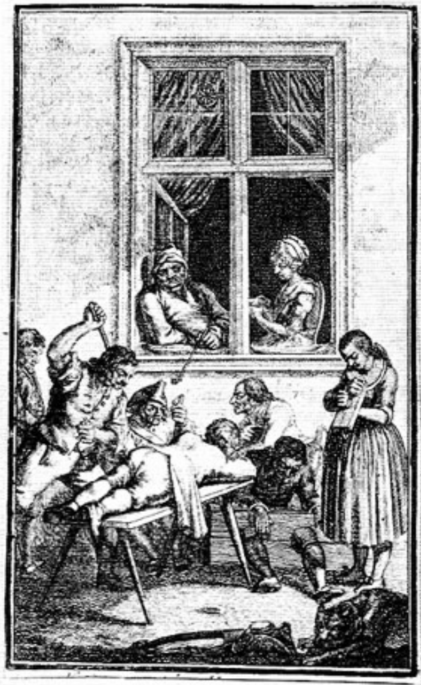
Ausprägung eines Verurteilten. Stich aus der Mitte des 18. Jahrhunderts.

Daher wird derselbe mit einem »scharpfen Verweis« bestraft. Obwohl man Ursache hätte, ihm als »einen Rebel-