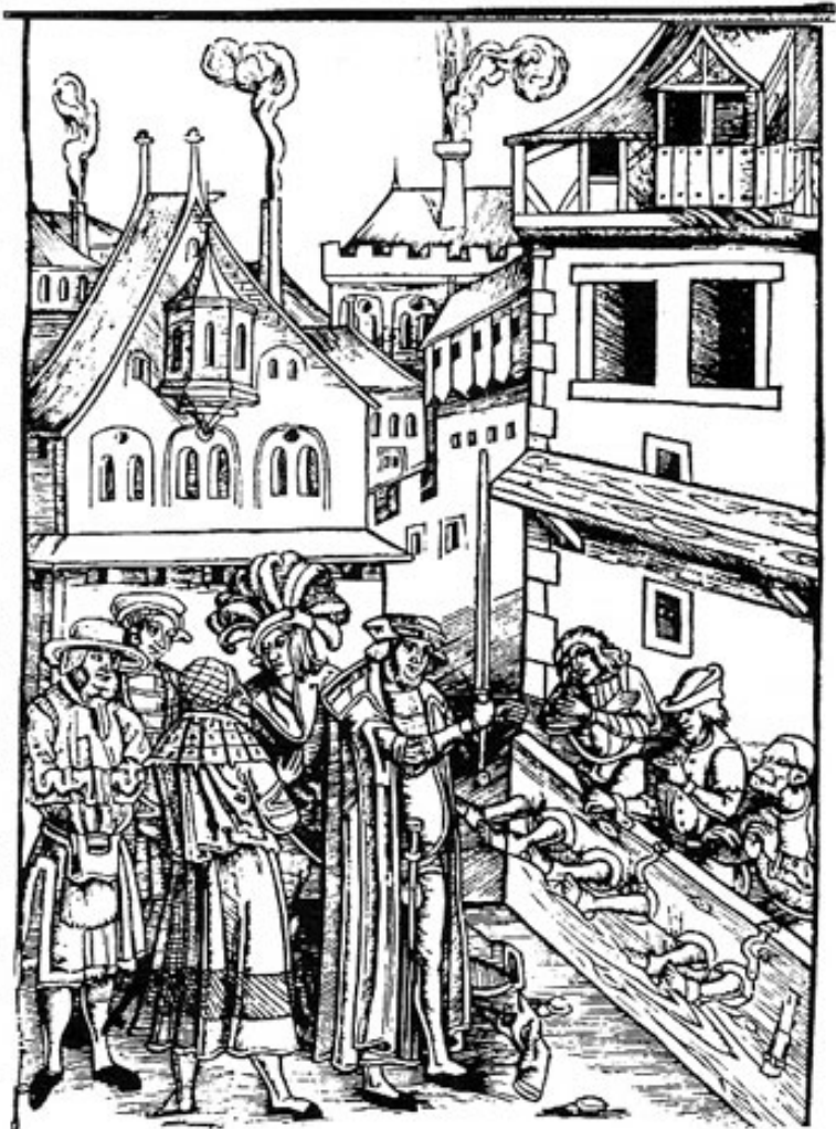
Gefangene im Stock. Holzschnitt um 1511.