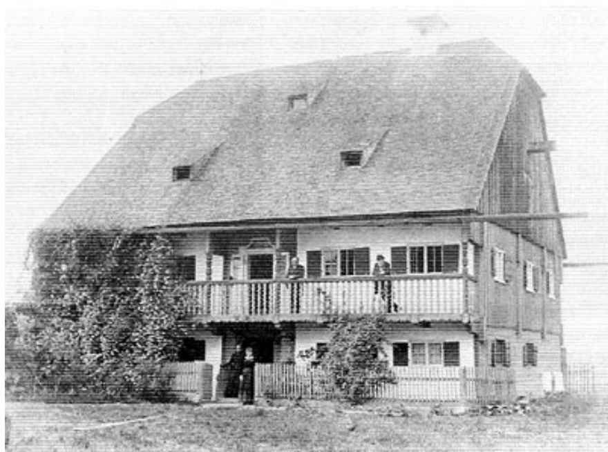
Der im Jahre 1904 abgebrochene alte Pfarrhof von Fürholzen.

Allgemein diente zum Unterhalt der Pfarrei die eigene Ökonomie und die zu Fürholzen war 1591 mit einem Viehstand von 3 Rössern, 8 Kühen, 5 Jungrindern, 2 Schweinen, 5 Schafen und 1 Lamm einem ganzen Hof gleichzusetzen 20 . Anno 1610 steht geschrieben: »Der Pfarrer baut auf jedes Feld (drei) bei acht Juchart Acker selbst.« Die Äcker und Wiesen des Widdums änderten ihre Flächenzahl durch Zukauf und Tausch häufig; 1820 betrug die Flächengröße 82 Tgw. 46 Dezimal. 1835 bereits 155 Tgw. 92 Dez. — Im übrigen bezog ein Pfarrer aus pfarr- bzw. kircheneigenen Gründen zu Deutenhausen, Oberröblich und Günzenhausen einen gewissen Getreidezehent, dazu von einzelnen Bauern den ganzen oder Teilzehent aus Fürholzen, Ottenburg, Kleinnöblich, Geselthausen, Massenhausen, Weng, Eisenbach und Haimhausen und zwar aufgrund alter Zehentrechte der Pfarrei. Die Reichnisse bestanden in Getreide, Geflügel, Eier und einem kleinen Geldbetrag 21 .