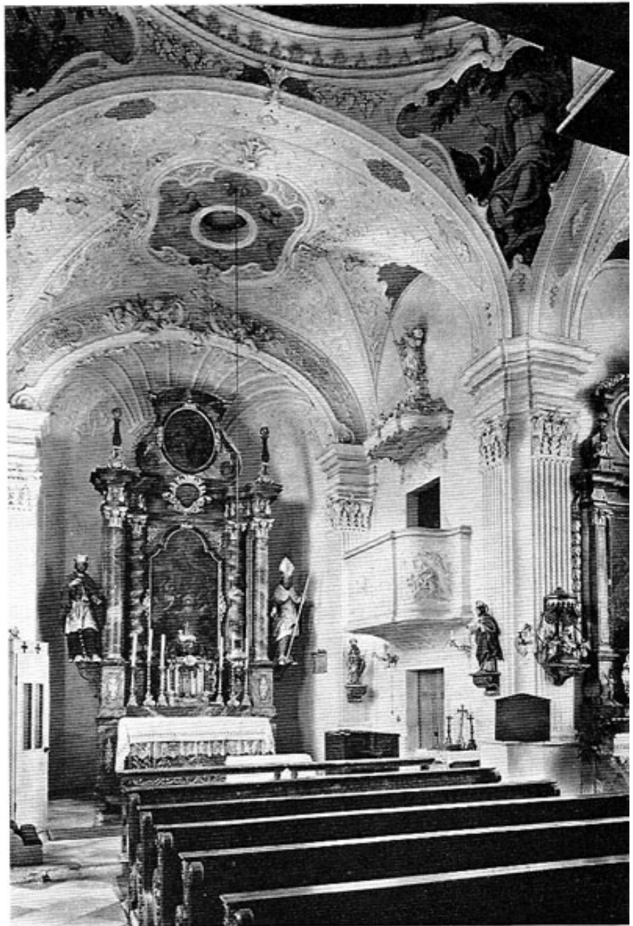
Inneres der Pfarrkirche Fürholzen.

und an deren Rändern stehen. — Aus dem Kataster von 1812 sind die alten Zehentleistungen noch ersichtlich. Die Anwesen Nr. 1, 3, 5, 6, 11 leisteten ihren Getreidezehent zur Stefanskirche Fürholzen, die Anwesen Nr. 2, 7, 8, 9, 10, 12, 14, 15 und 17 reichten je ein Drittel Zehent den Pfarreien Massenhausen und Fürholzen und dem Benefizium in Neufahrn, der Pichlmayrhof außerdem aus einem Acker den halben Zehent an das Rentamt Freising. Fürholzen bestand 1752 aus 15 Anwesen und gehörte 1812 zu dem Steuerdistrikt Massenhausen. Mitte des 18. Jahrhunderts war der ¼-Hof »beim Glas« mit Zubau dem Domkapitel Freising zugehörig. Die Langmayr- und Kelnbäckhöfe wirtschafteten unter dem Andreasstift in Freising, das ⅙-Fertlgütl war Eigentum des Klosters Tegernsee, die Pichlmayr- und Häringhöfe dienten dem Freisinger Hochstift, der Schuhbauerhof dem Freisinger Hl.-Geistspital, der Sacherbäckhof dem Leprosenhaus in Freising, der Endelhof (Edel) dem Benefizium zu Weng und mit dem ⅙-Zubaugütl der Kirche Inhausen. Das