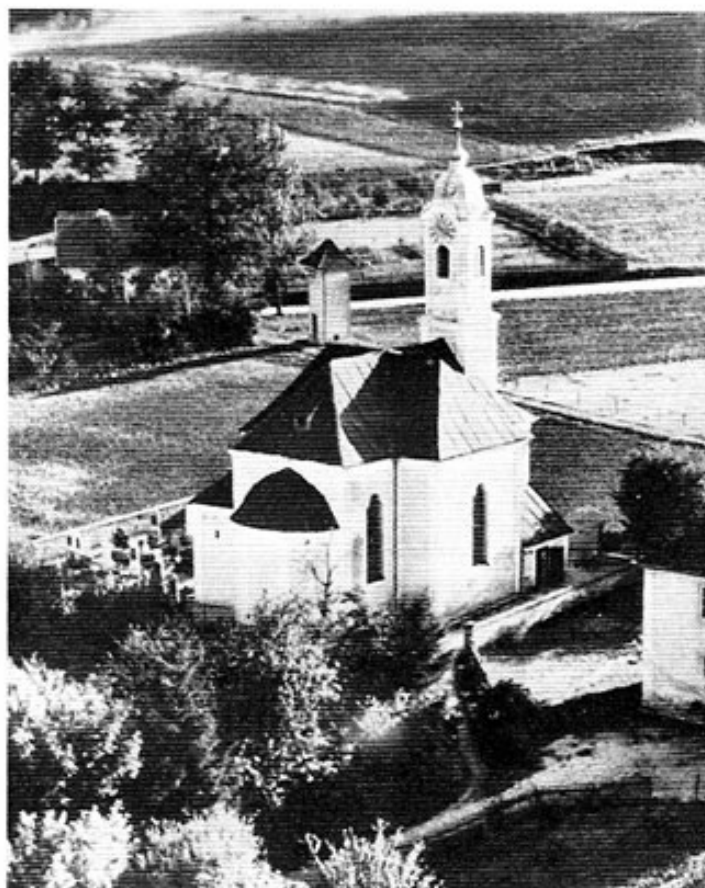
Die Pfarrkirche St. Stephan in Fürholzen.