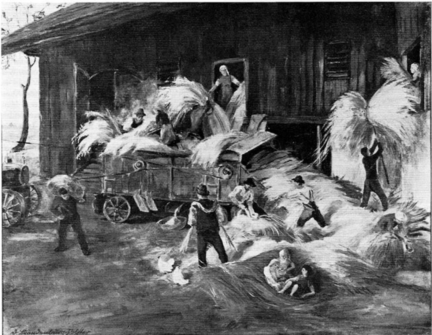
Abb. 1: Dora Brandenburg-Polster: Die Dreschmaschine. Öl, 68 x 86 cm. Im Kunsthandel.

Bindungen. Eine große Anzahl Dachauer Bilder — Aquarelle und Federzeichnungen — stammen von ihrer Hand. Durch ihre 1911 erfolgte Heirat mit dem Schriftsteller Hans Brandenburg wurde Dora Polster die Schwägerin des bekannten Dachauer Arztes und späteren Sanitätsrates