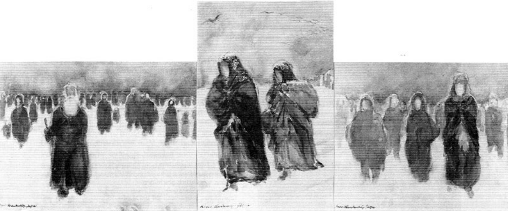
Abb. 3: Dora Brandenburg-Polster: Triptychon »Die Vertriebenen«. Aquarelle je ca. 35 x 55 cm. Im Kunstbandel.